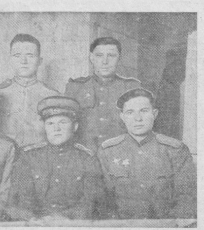
Мардлик — мангулик

Мамлакатимиз спорт журналилари газета ва журналлар редакция- лари авваллар ўртасида баскетбол чемпионатининг энг ях- ши қатнашчиларига сов- ринлар таъсис этишган. Жумладан, «Чемпион- нинг энг сермахсул