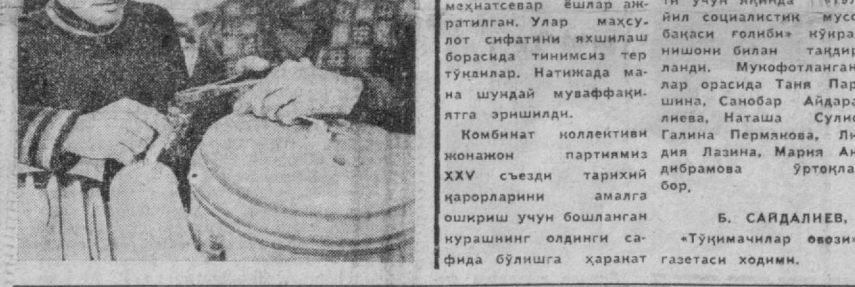
«Маль-маль» газламасига-СИФАТ БЕЛГИСИ

Тўқимачилик номби-натиди хушхабар тар-қалди. Корхонада ишлаб чинарилаётган «Маль-маль» газламасига «Дав-лат Сифат белгиси» бе-лиги. Бу тўқимачилик-нинг бир йиллик фидо-корона яратувчилик меҳнатига берилган юк-сак баҳоидир.