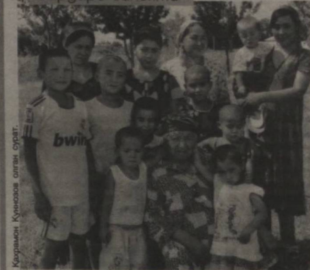
Туйғунон ая негара-чеваралари билан.