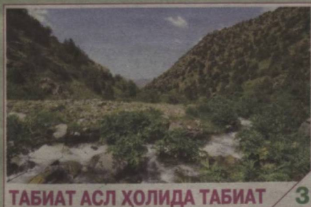
ТАБИАТ АСЛ ҲОЛИДА ТАБИАТ 3