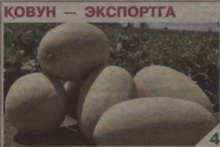
ҚОВУН — ЭКСПОРТГА 4