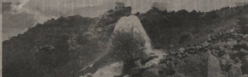
Зоология институти томонидан «Муҳофаза этиладиган худудларнинг шакли ва таш-

Дастур доирасида Муҳофаза этиладиган табиий худудлар тизимини такомиллаштириш борасида Ўзбекистон Республикаси Фанлар Академиясининг илмий-текшириш ин-