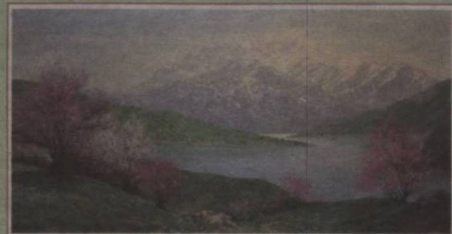
ЮРТ КЎРКИГА ОШУФТАЛИК ТУЙҒУСИ 8