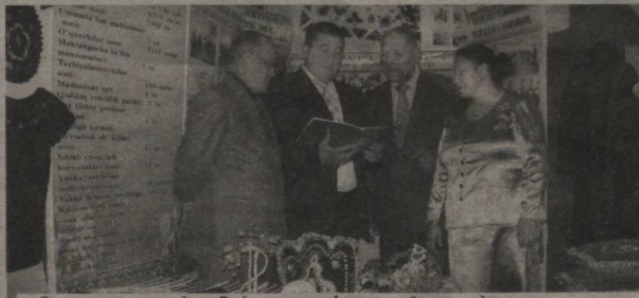
Элиқалъа туманидаги Гулдирсин овул фуқаролар йиғини ходимлари.

Хусан ТЕМИРОВ, “Qishloq hayoti” мухбири.