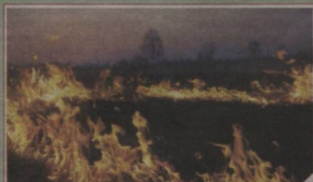
ЁНАЁТГАН ХАЗОН, БАРЧАГА ЗИЁН