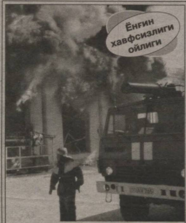
Ёнғин хавфсизлиги ойлиги

Мурожаат учун тел: +99890 715-27-47, +99891 312-02-12.