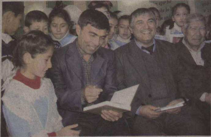
лар ўқиб беришди.

Ўқитувчи ва ижодкор маҳнатининг ўхшаш томонлари кўп. Иккиси ҳам оламга, ёшлар қалбига зиб таратади. Дунё ва унинг моҳияти, ҳаёт сабоқлари ҳақидаги билими билан уларнинг юрагини забт этади, онгу шуурини равшанлаштиради, юракларига йўл топиш учун муттасил изланади. Ўқитувчининг ҳам, ижодкорнинг ҳам юзма-юз суҳбатдоши, сирдоши, тингловчиси ўқувчидир.