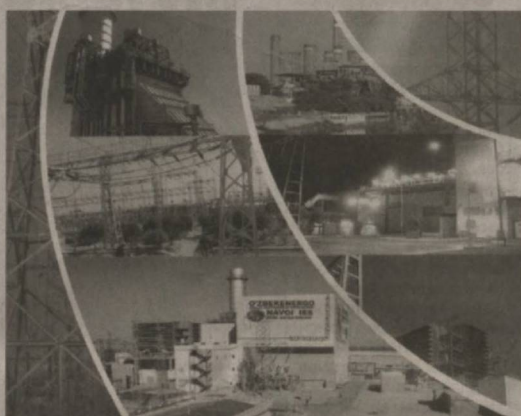
Мустақиллигимизнинг 21 йиллиги байрами арафасида 7 та объект бўйича қурилиш ишлари тугалланиб фойдаланишга топширилди.

Унда таъкидлаб ўтилганидек, Президентимизнинг «2011-2015 йилларда Ўзбекистон Республикаси саноатини ривожлантиришнинг устувор йўналишлари тўғрисида»ги ҳамда «Ўзбекистон Республикасининг 2012 йилги Инвестиция дастури тўғрисида»ги Қарорларига мувофиқ «Ўзбекэнерго» ДАК томонидан мамлакатда электр энергия ишлаб чиқариш ва узатиш тизимини модернизация қилиш лойиҳалари амалга оширилмоқда.