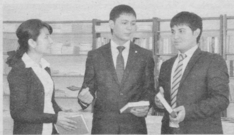
Шавкат РАХИМОВ, Бош прокуратура бошқарма катта прокурори

Бугунги кунда мамлакатимизда ёш авлодни ҳар томонлама соғлом ва баркамол этиб вояга етказиш давлат сиёсатининг устувор вазифаларидан ҳисобланади. Шунингдек, уларнинг биздан кўра кучли, билимли, доно ва албатта, бахтли бўлишлари учун етарли шарт-шароитлар яратилиб, барча имкониятлар ишга солинмоқда. Юртимизнинг турли ҳудудларида қад ростилаган замонавий ўқув даргоҳлари-ю спорт-соғломлаштириш иншоотлари фикримизнинг аққол далилидир.