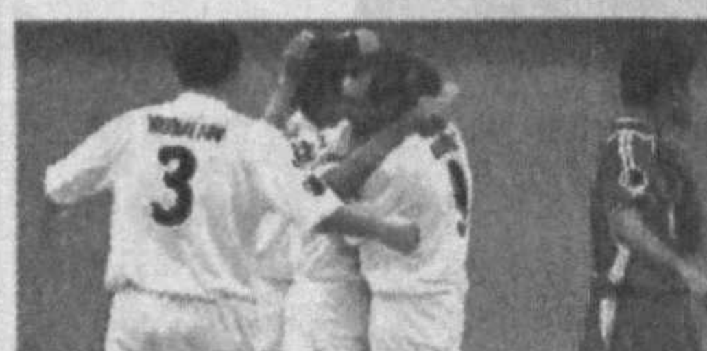
Эрон пойтахти Тегрон шаҳрида футбол бўйича халқаро турнир якунланди.

валар якунда 7,5 тадан очко жамғариб, олий лига йўлнамасини қўлга киритишди.