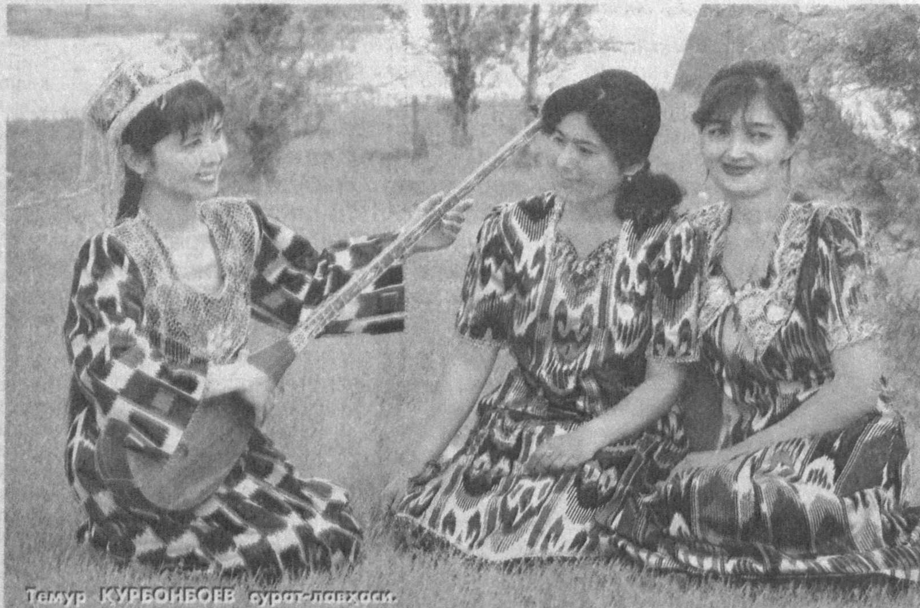
Тасвир: КҮРБОНОВЕВ сурат-лаҳзада.

Президентимизнинг «Болалар мусиқа ва санъат мактабларининг моддий-техник базасини мустаҳкамлаш ва уларнинг фаолиятини янада яхшилаш бўйича 2009-2014 йилларга мўлжалланган Давлат дастурини тайёрлаш чора-тадбирлари тўғрисида»ги Фармойишини жамоамиз аъзолари, ўқувчи-ёшлар катта мамнуният билан кутиб олди.