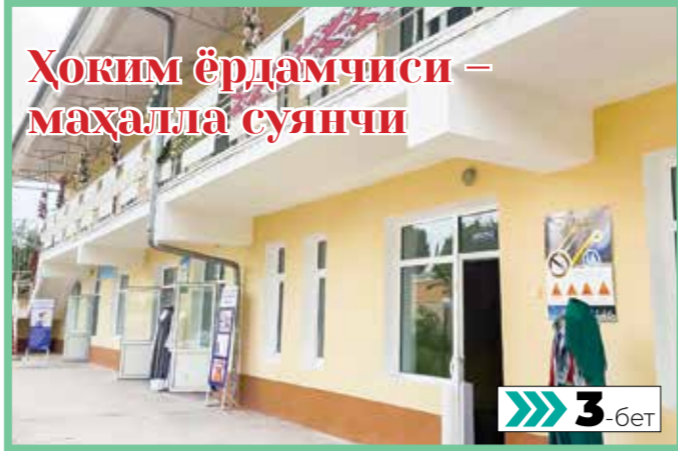
Ҳоким ёрдамчиси – маҳалла суяничи