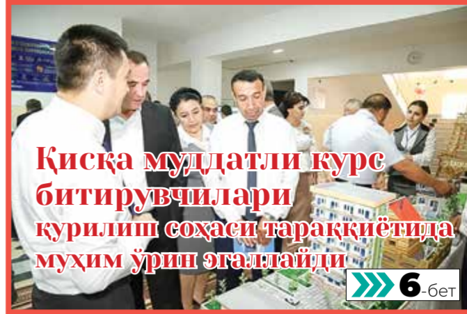
Қисқа муддатли курс битирувчилари қурилиш соҳаси тараққиётида муҳим ўрн эгаллаётди