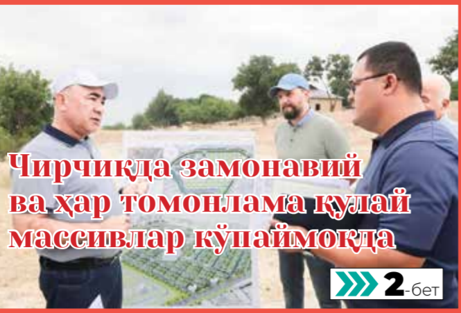
Чирчиқда замонавий ва ҳар томонлама қулай массивлар қўнаймоқда