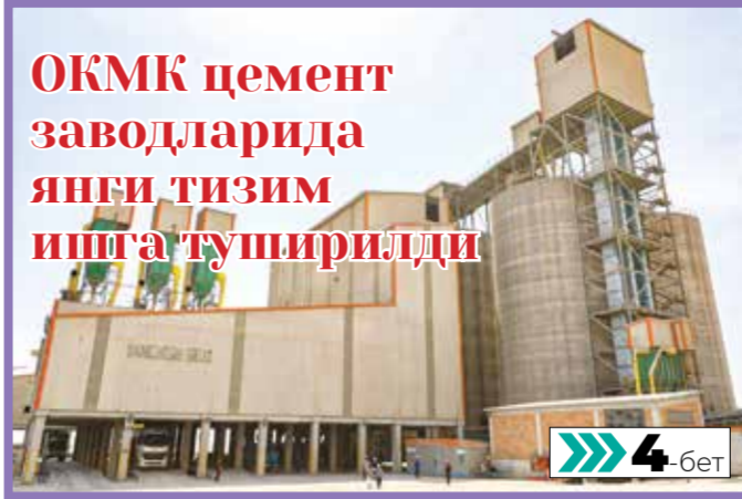
ОКМК цемент заводларида янги тизим ишга туширилди