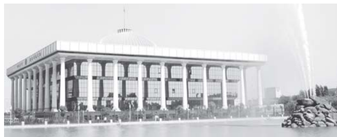
Фракции поддержали законопроект

Предусмотренные законопроектом нормы развития государственной системы дошкольного образования, обеспечения права каждого ребенка на подготовительное обучение, бесплатное государственное общее среднее образование, обязательное общее среднее образование и продолжение получения дальнейших знаний независимо от материального положения соответствующей предвыборной программе Демократической партии «Миллий тиклишиш». В доработке и подготовке законопроекта приняло активное участие большинство членов фракции партии «Миллий тиклишиш». Проект принят депутатами.