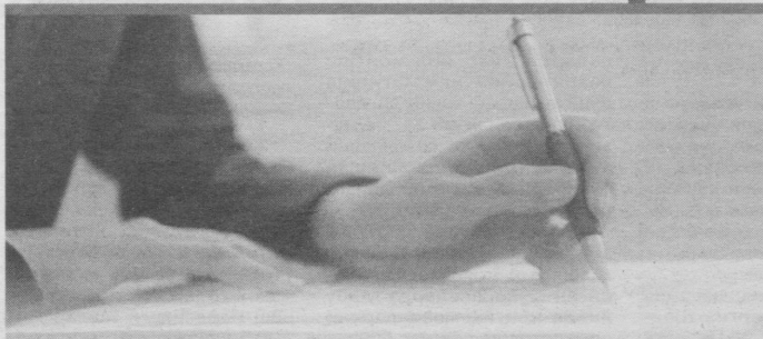
[Давоми. Бошланиши 1-бетда]

Вилоят прокурори ва барча мутасадди идораларнинг раҳбарлари масъуллигида мурожаатлар билан ишлашнинг самарадорлигини оширишга қаратилган ишчи гуруҳи тузилди. Шунингдек, мурожаатларни жойида ўрганиш ва қонуний ҳал этиш мақсадида Қарши шаҳри ва барча туманларга давлат бошқаруви, ҳуқуқни муҳофаза қилувчи ва назорат органларининг масъул ходимлари бириктирилди.