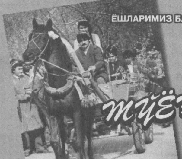
ЁШЛАРИМИЗ БАХТЛИ БЎЛИШСИН!

МЕХРИ ДАРЁ ОНАХОНЛАР ВА НУРОНИЙ ОТАХОНЛАР УЧУН МАХСУС ОМОНАТЛАР