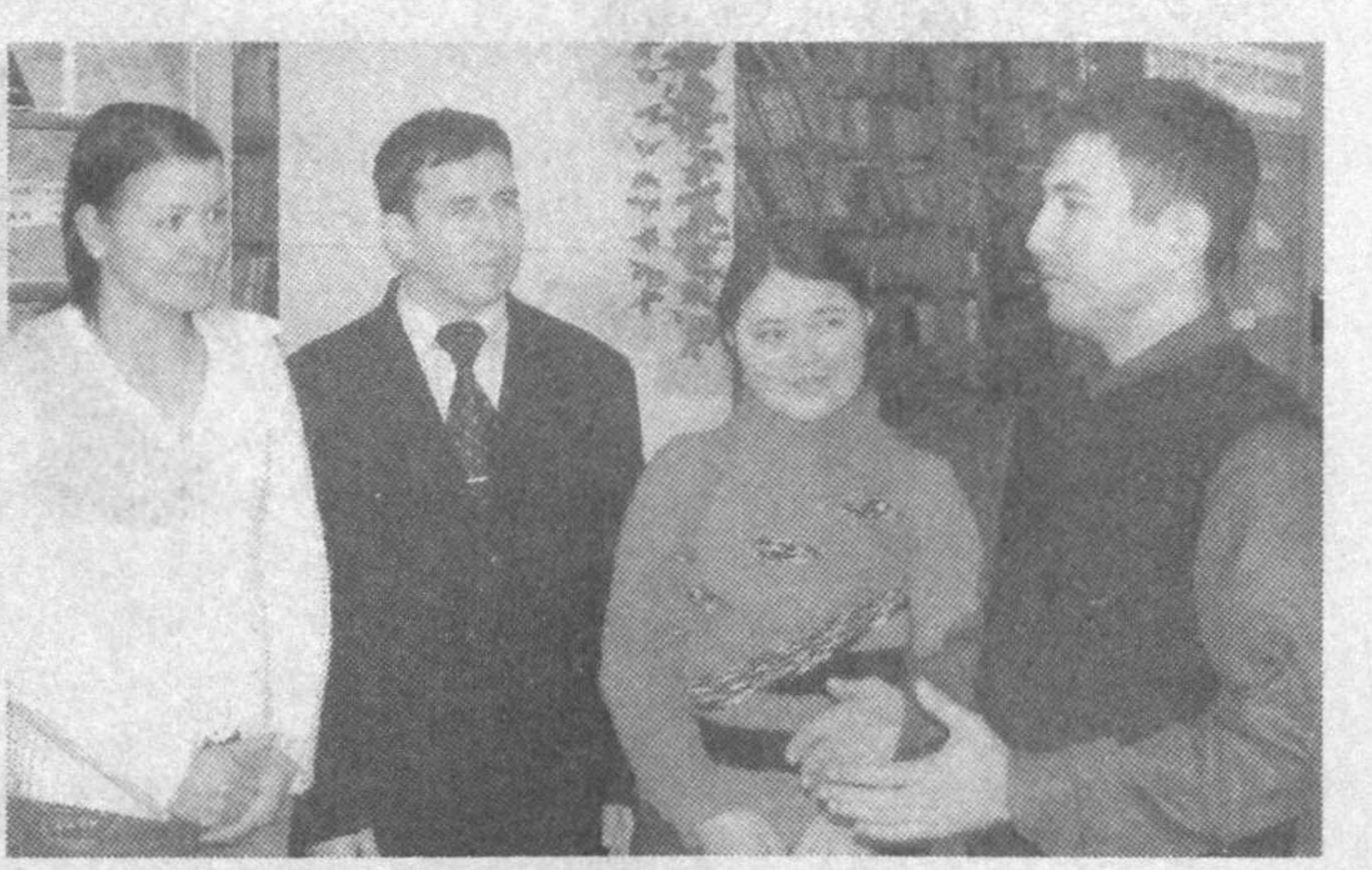
Қарши шаҳрида кейинги йилларда замонавий меъморчиликнинг сўнгги ютуқлари асосида қад кўтарган қўллаб-қувватлаш маъмурий бинолар орасида Ёшлар маркази ўзига ҳослиги билан ажралиб туради. Яқинда ишга тушган бу маскан бугунги кунда нафақат Қарши шаҳри, балки бошқа туманлардаги ўқувчи ва талаба, ишчи ва зиёли ёшларнинг севимли масканига айлиниб қолди. Навқирон авлодининг дунёқарашини шакллантириш, маънавиятини юксалтириш, билиминини ошириш, иш билан таъминлаш, ижтимоий фаоллигини қузатиш масалаларига бағишланган катта-катта анжуманлар ҳам шу ерда ўтмоқда.