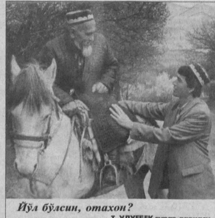
Йўл бўлсин, отахон?