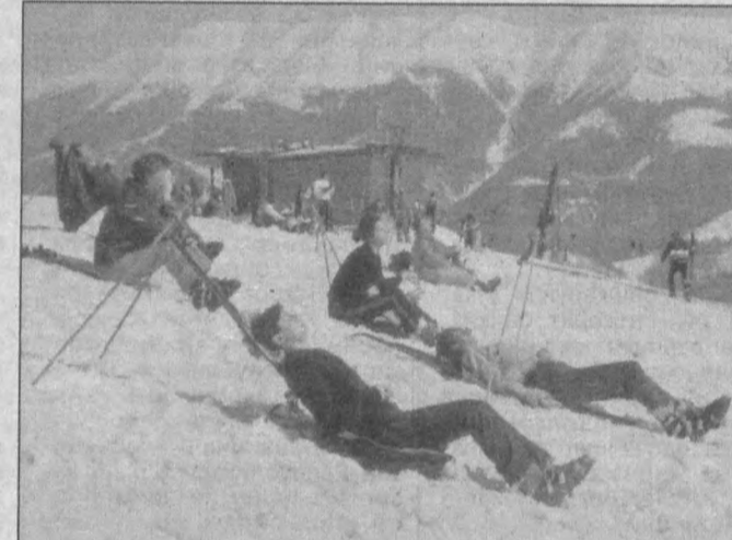
СУРАТДА: Словакиянинг тоғларга туташ Доновал қишлоғи февраль ойида дам олувчилар ва сайёҳлар билан гавжум бўлади. Бу ерда чанги учувчилар учун барча шарт-шароитлар, замонавий меҳмонхоналарда сайёҳлар учун жамини қулайликлар мавжуд.

Жанубий Осиёда рўй берган молиявий иқшороз АҚШ маъмуриятини ҳам бефарқ қолдираётгани йўқ. Чунки мазкур региондаги мамлакатлар АҚШнинг ишрок савдо шериклари бўлиб, иқтисодий алоқаларининг кўлами ниҳоятда кенг. Шу боис АҚШ молиявий тангликни бартараф этиш юзасидан ушбу миттақанинг 21 давлати иштирокчида кенгаш ўтказишга қарор қилди.