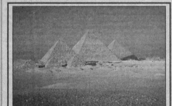
Ҳамма нарса вақтдан кўради, вақт эса Миер эҳромларидан.

ВАЗИЯТ БИРОЗ ЮМШАДИ Ироқ Президенти Саддам Ҳусейн ниҳоят БМТ инспекторларига «Президент объектларини» текширишга рухсат берганини эълон қилди. Фақат инспекторлар таркибига қўшни араб давлатларидан ҳам вакиллар бўлиши лозим, деган тақлиф ҳам илгари сурилди.