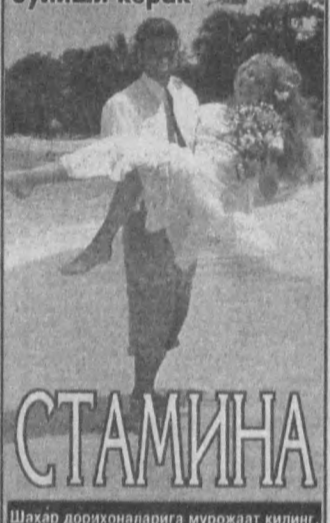
Шаҳар дорихоналарига мувожаат қилинг.