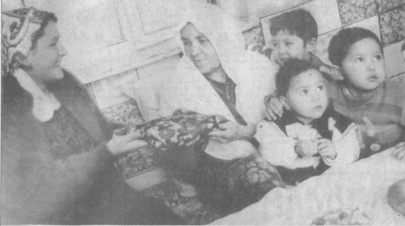
Бағри тўлиқ бўлар мудом ўзбекининг.