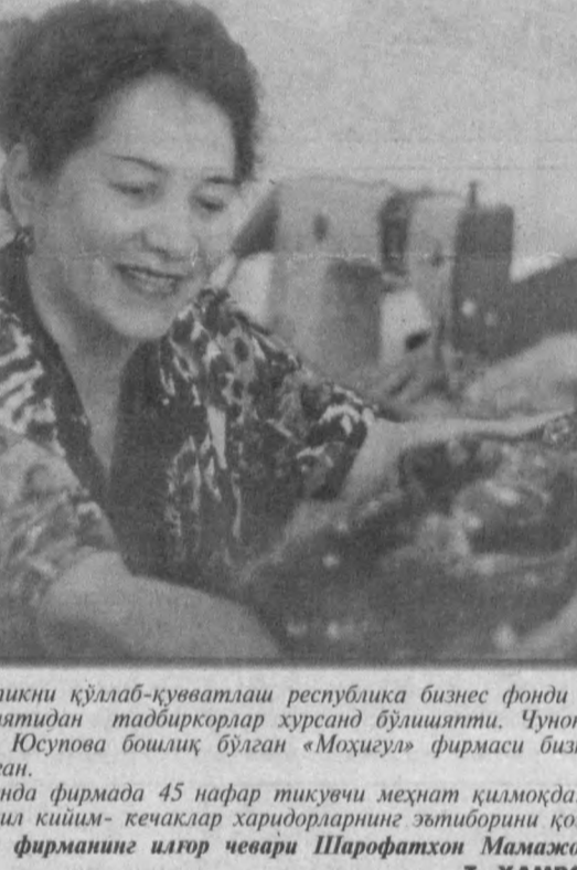
Хўрсиди кўнда фирмага 45 нафар тикувчи меҳнат қилмоқда. Корхонада таёйинлаётган турли хил қишим-кечаклар харидорларнинг эътиборини қозонмоқда.