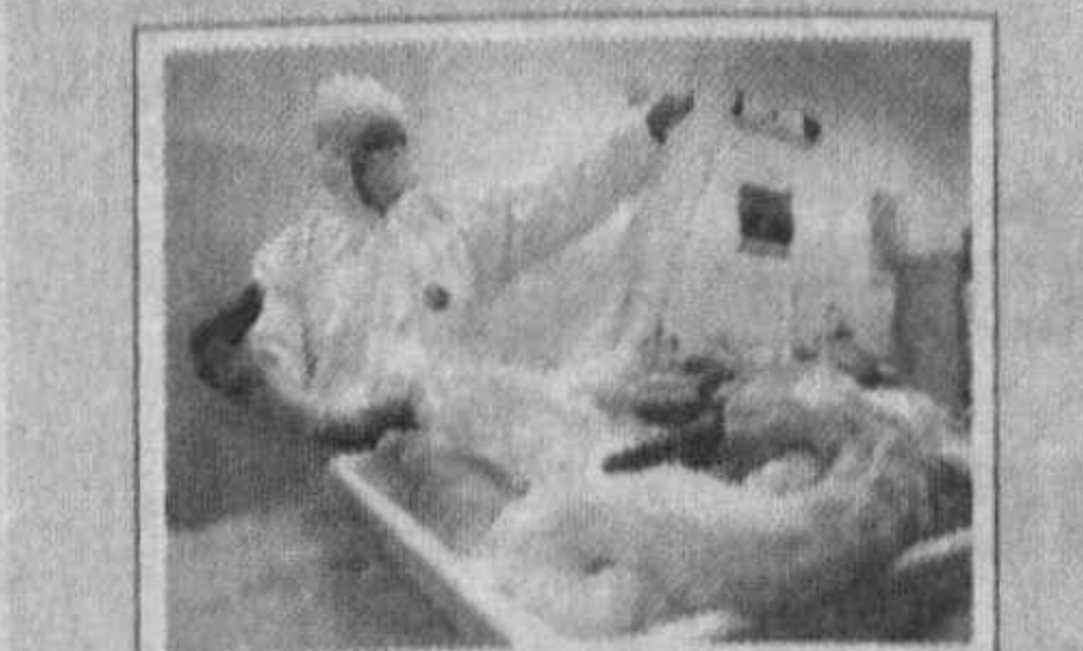
Хориж матбуоти хабарлари асосида тайёрланди.

Бу ҳақда мамлакат экология вазири маълум қилди. Хабарларда келтирилишича, мазкур вирус яриморолдаги оққушларда учраган. Айни дамда ҳукумат яриморолдаги ва Акита, Аомори ҳамда Хоккайдо шаҳарларидаги барча қушларни текширувдан ўтказмоқда.