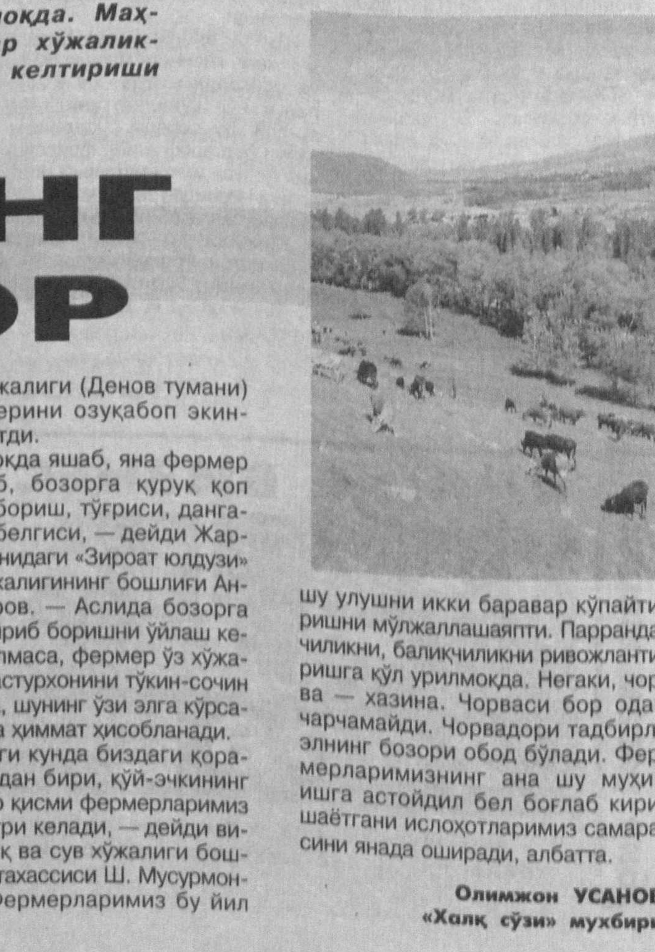
Олимжон УСАНОВ, «Халқ сўзи» мухбири.