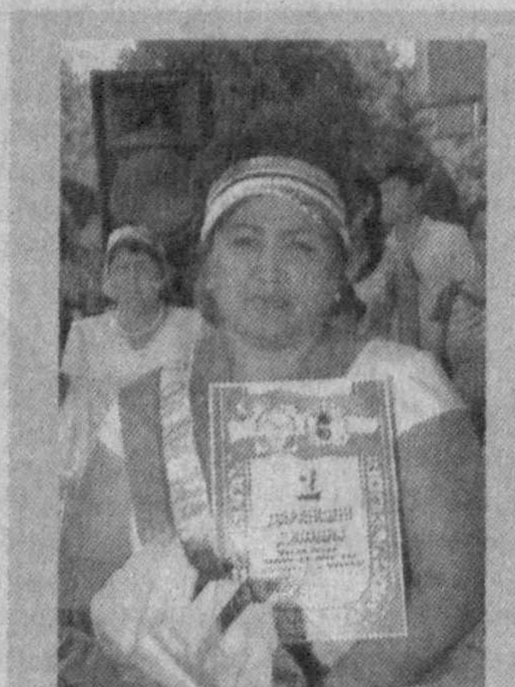
Пойтахтимиздаги Алишер Навоий номидаги Ўзбекистон Миллий боғида «Автоолам маликаси — 2008» кўрик-танловининг республика босқичи бўлиб ўтди.