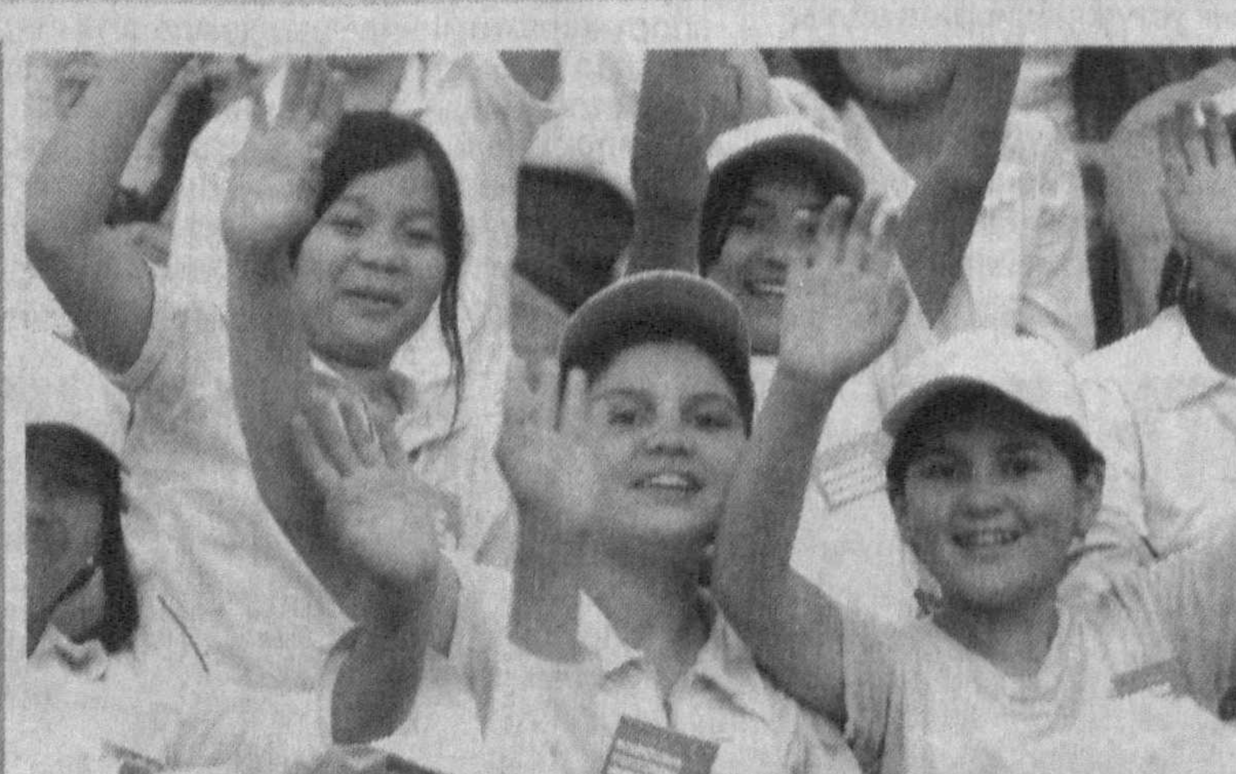
амалга ошириш механизми тажрибадан ўтмаган янги ҳаракатни бошланғич иштирокчида синовдан ўтказиш — «Умид нихолари»га таянган табиқий ҳаётининг талаби бўлган. Бундан ташқари табиқий спорт илк бор мактабда ўқувчининг кундалик эҳтиёжига айланса, академик лицей ва касб-хўнаҳар коллежларида ёшларнинг доимий ҳамроҳи бўлиб қолди. Университет ва институтларда эса талабалар ушбу тизим орқали нуфузли халқаро майдонларга йўл очмоқда, юракда, қалбда алангаланган шад билан юрт шаънини ҳимоя қилаётди.

Ушбу босқичларнинг ҳаммаси ўзига хос байрам тарзида ташкил этилади. Ҳеч қим эътибордан четда қолмайди. Мактаб босқичида ғолиб бўлган ўқувчилар ҳам фах-