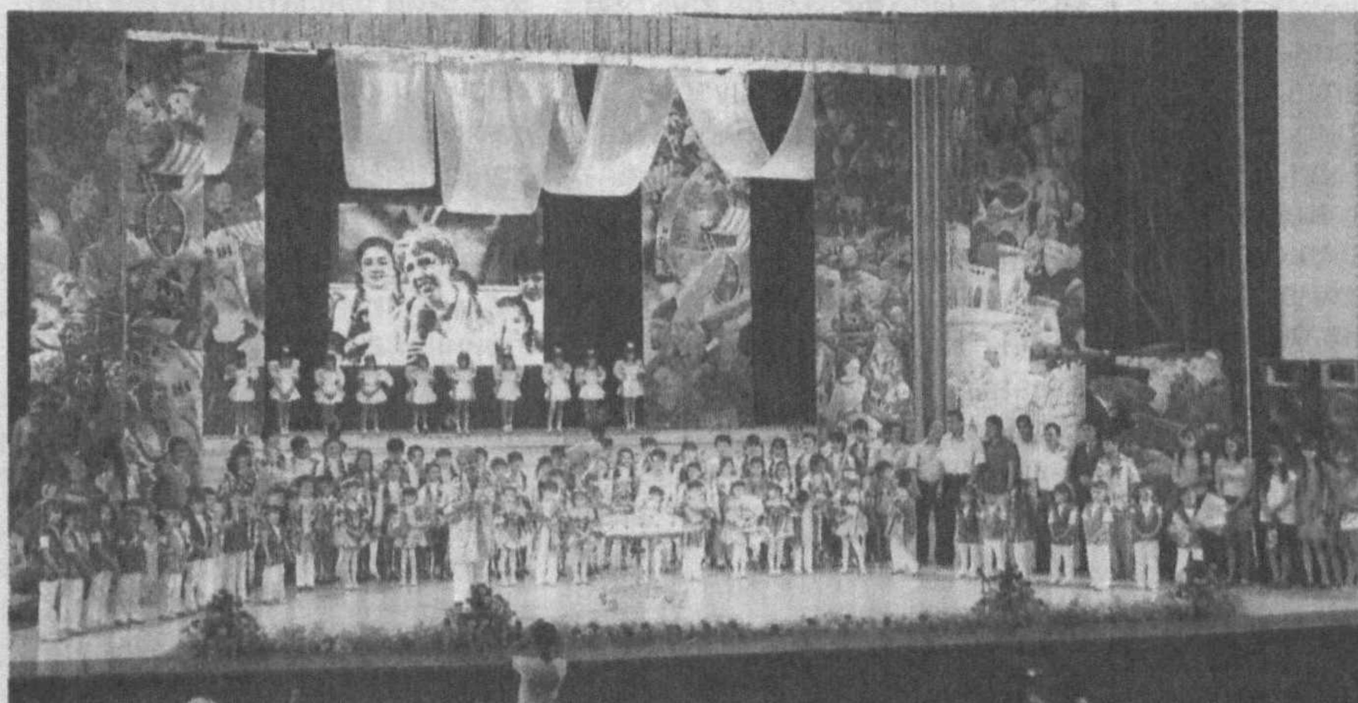
2008 йил — Ёшлар йили

“Туркистон” саройида 1 июнь — Халқаро болаларни ҳимоя қилиш кунига бағишланган байрам тадбири бўлиб ўтди. У Тошкент шаҳар ҳокимлиги, “Sen Yolg'iz Emassan”, “Соғлом авлод учун”, Болалар жамғармалари, қатор вазирлик ва ташкилотлар ҳамкорлигида ташкил этилди.