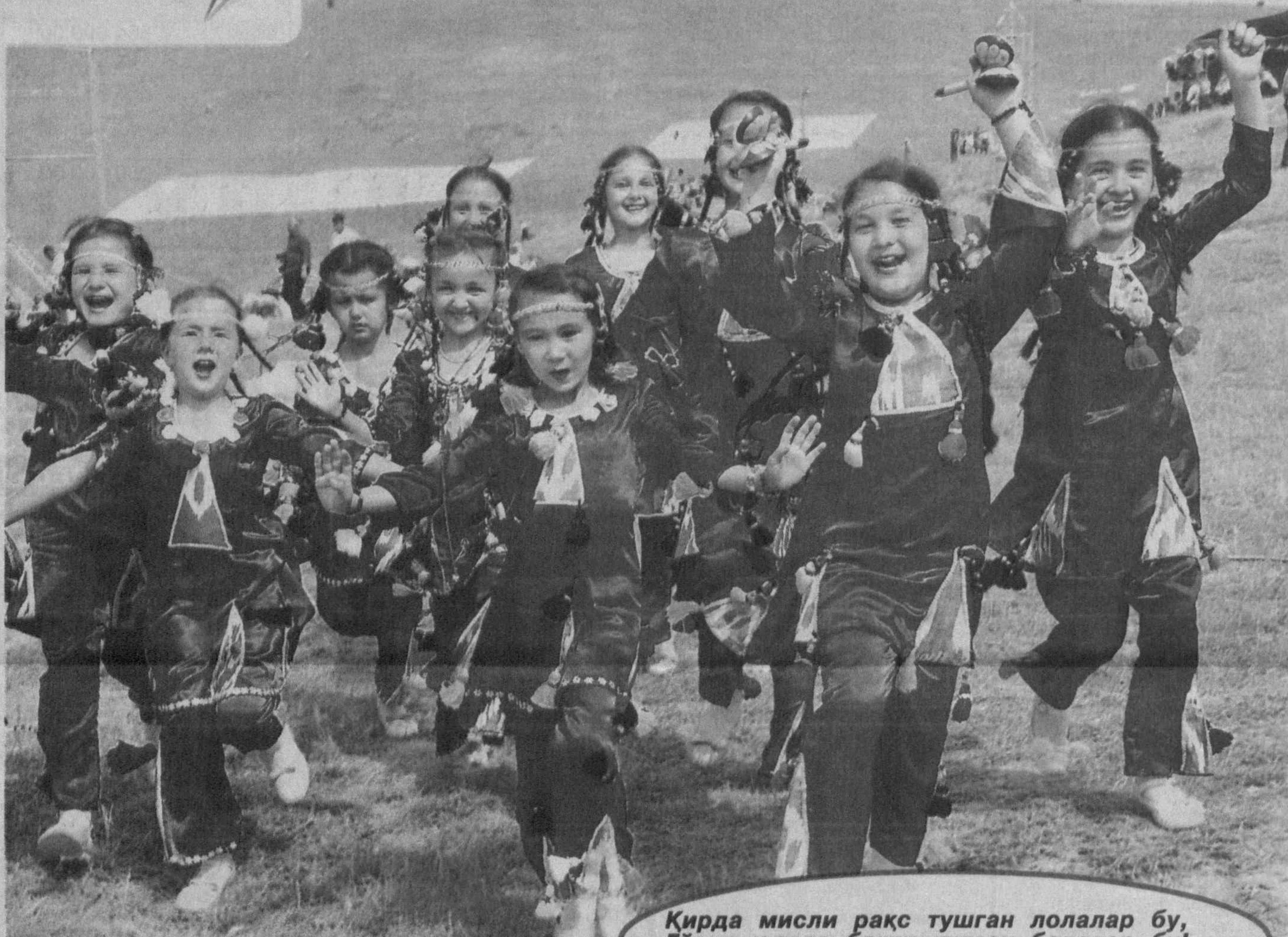
Қирда мисли рақс тушган лолалар бу, Гўзал юртда бахти қулган болалар бу!