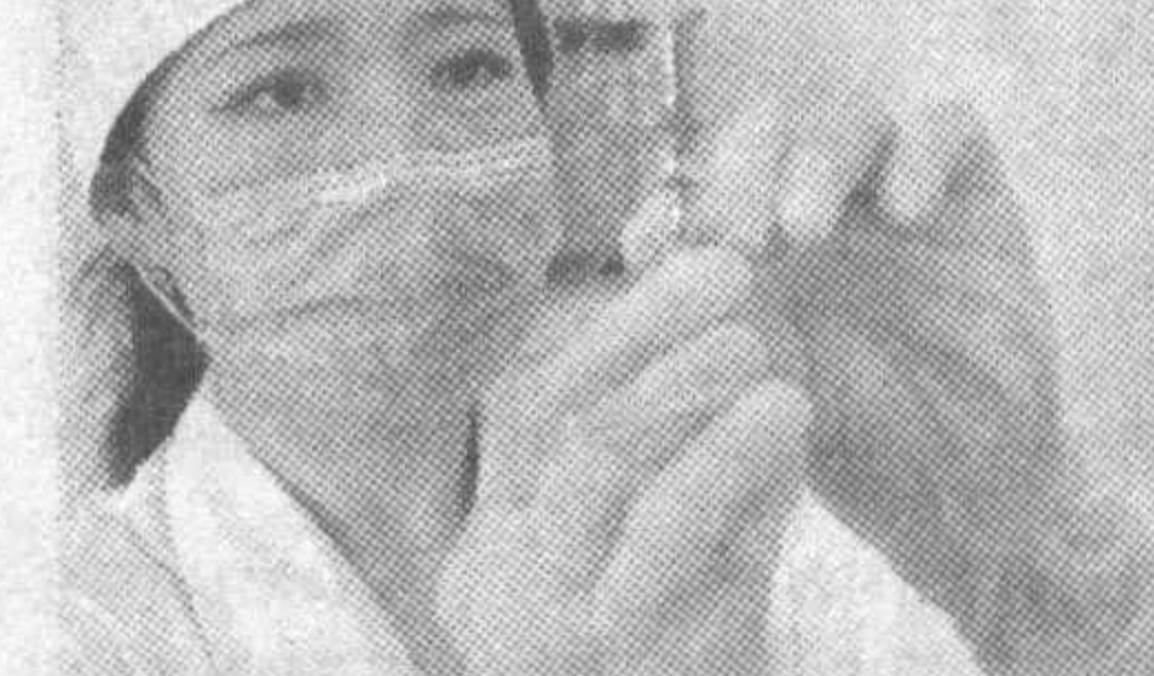
Тадқиқотчилар 1950-2005 йиллар оралиғида туғилган фуқароларнинг ривожланишини кузатиш асосида юқоридаги хулосага келишган.