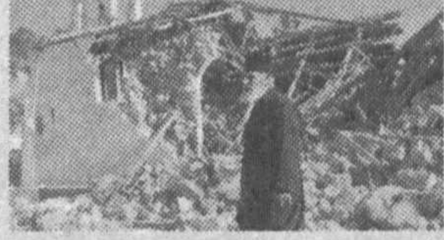
Новости'га берган интервьюсида бу ҳақда алоҳида таъкидлаб ўтган.