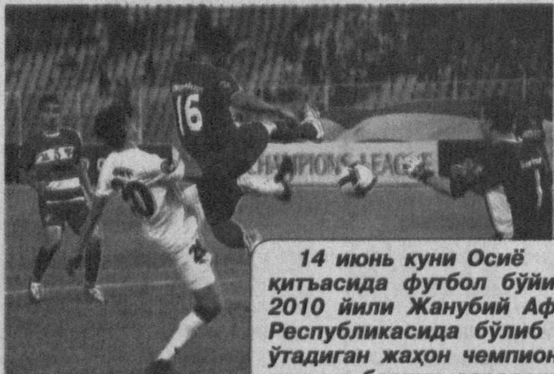
14 июнь кунин Осиё қитъасида футбол бўйича 2010 йили Жанубий Африка Республикасида бўлиб ўтадиган жаҳон чемпионати учинчи босқич саралаш учрашувлари бўлиб ўтди.

Ўзбекистон терма жамоаси пойтахтимиздаги МХСК стадионида Ливан футболчиларини қабул қилди. Эсингизда бўлса, ҳамюртларимиз учинчи босқич илк саралаш учрашувини февраль ойида сафарда Ливан терма жамоасига қарши ўтказиб, 1:0 ҳисобида зафар қўнган эди.