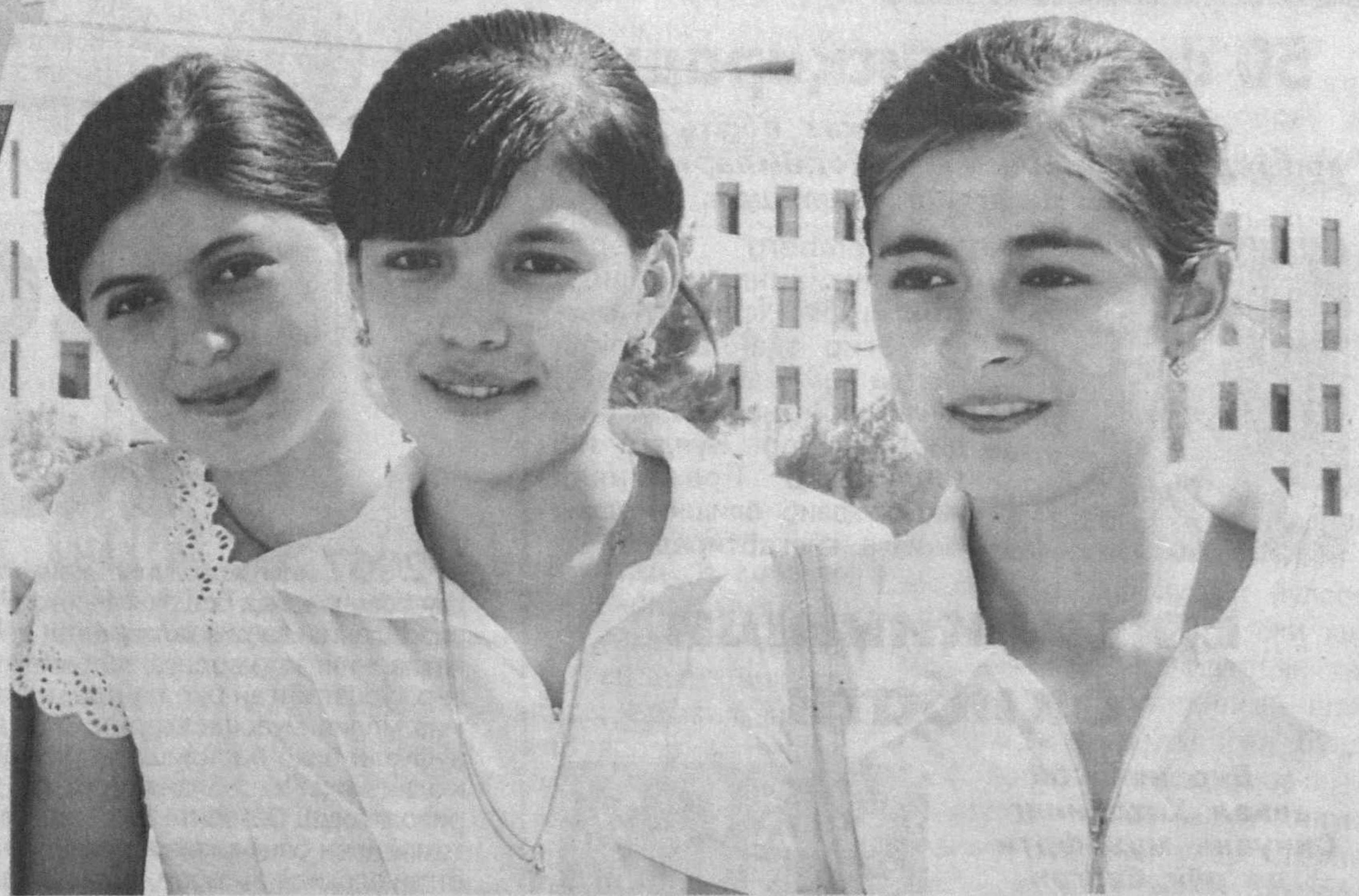
Чақнаган кўзлар — бахтидан сўзлар.

"Энг гуллаган ёшлик чоғимда" саҳифасида истиқлолнинг бахтиёр ёшлари ҳаёти ҳақида ҳикоя қилинади.