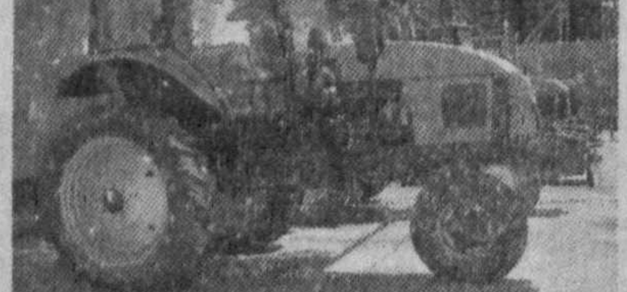
Ўрни босадиган ва экспортга йўналтирилган маҳсулотлар ишлаб чиқариш ҳақими тобора ошмоқда. Бунда Президентимизнинг 2007 йил 12 ноябрда қабул қилинган «Ички тармоқ ва тармоқлараро саноат кооперациясини янада кўчатириш чора-тадбирлари тўғрисида»ги Фармони муҳим омили бўлаётир.