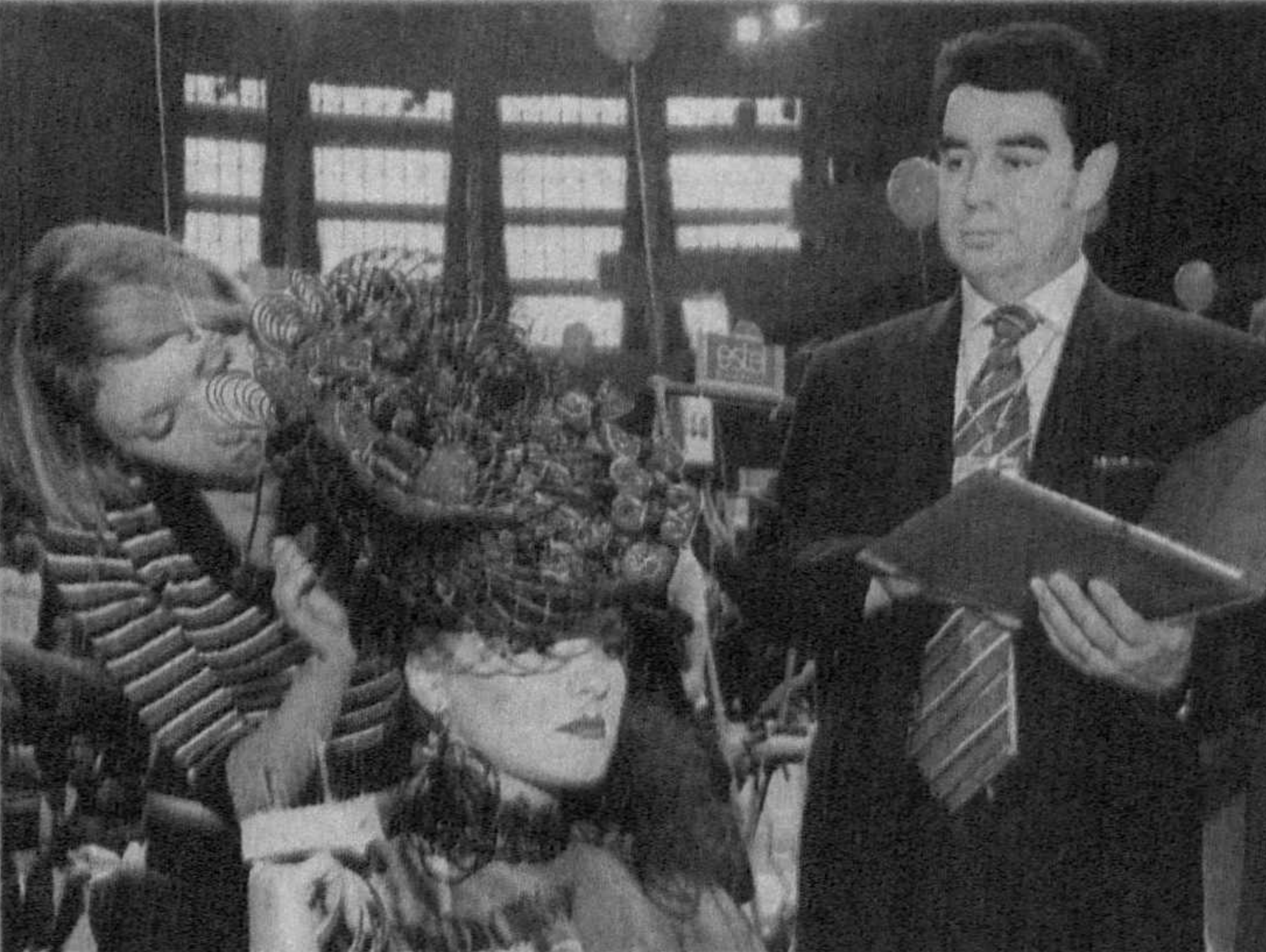
СУРАТДА: халқаро кўргазмадан лақа.