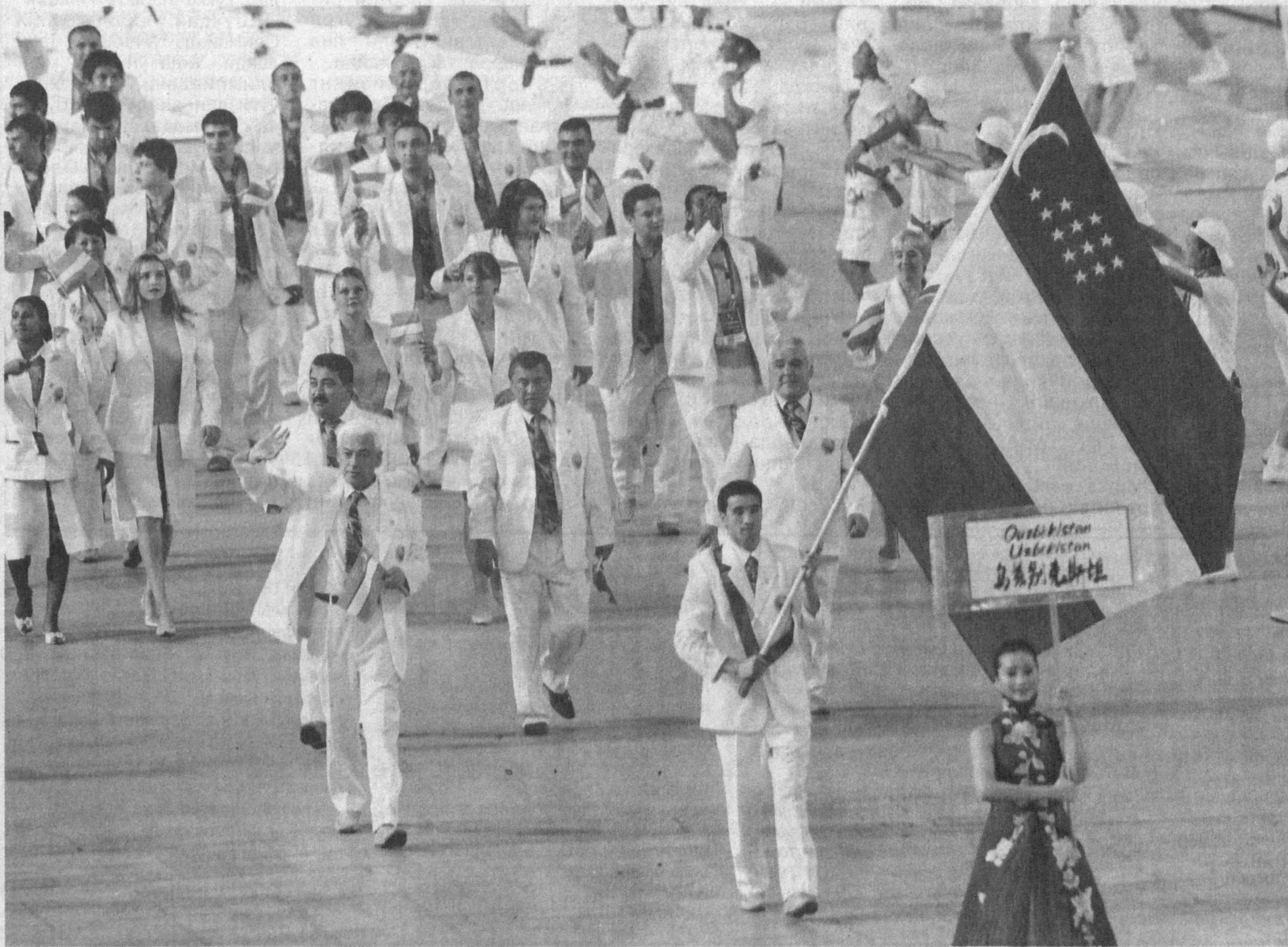
ПЕКИН. (ЎЗА махсус мухбири Зоҳир ТОШХУҲАЕВ хабар қилади).

8 август куни Хитой Халқ Республикаси пойтахти Пекин шаҳрида ХХХ ёзги Олимпиада ўйинларининг тантанали очилиш маросими бўлди.