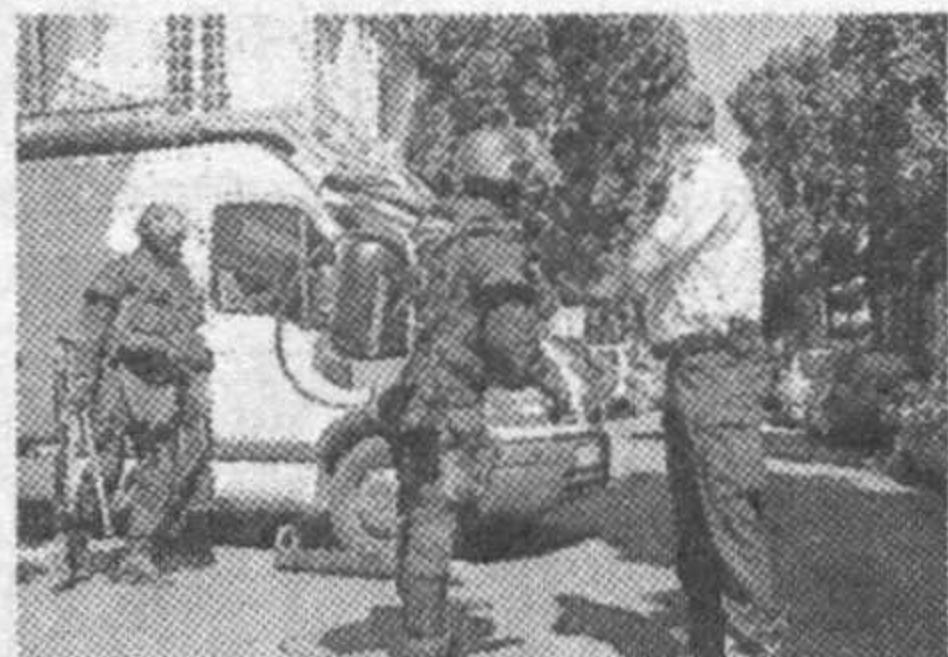
лумот берган. Махсус гуруҳ айнаи дамба яна иккита курилмани кидирмоқда.

«AFP»нинг хабар беришича, портловчи моддаларнинг иккитаси сайёҳлар гавжум Арканг худудидан топилган. Яна бир бомба Буко ва Ондр шарҳларига катновчи тезорар поездга ўрнатиш экан.