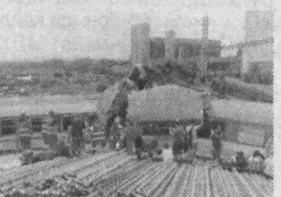
«Франс-пресс» ахборот агентлиги хабарига кўра,

Чехияда йирик темир йўл ҳалокати содир бўлди.