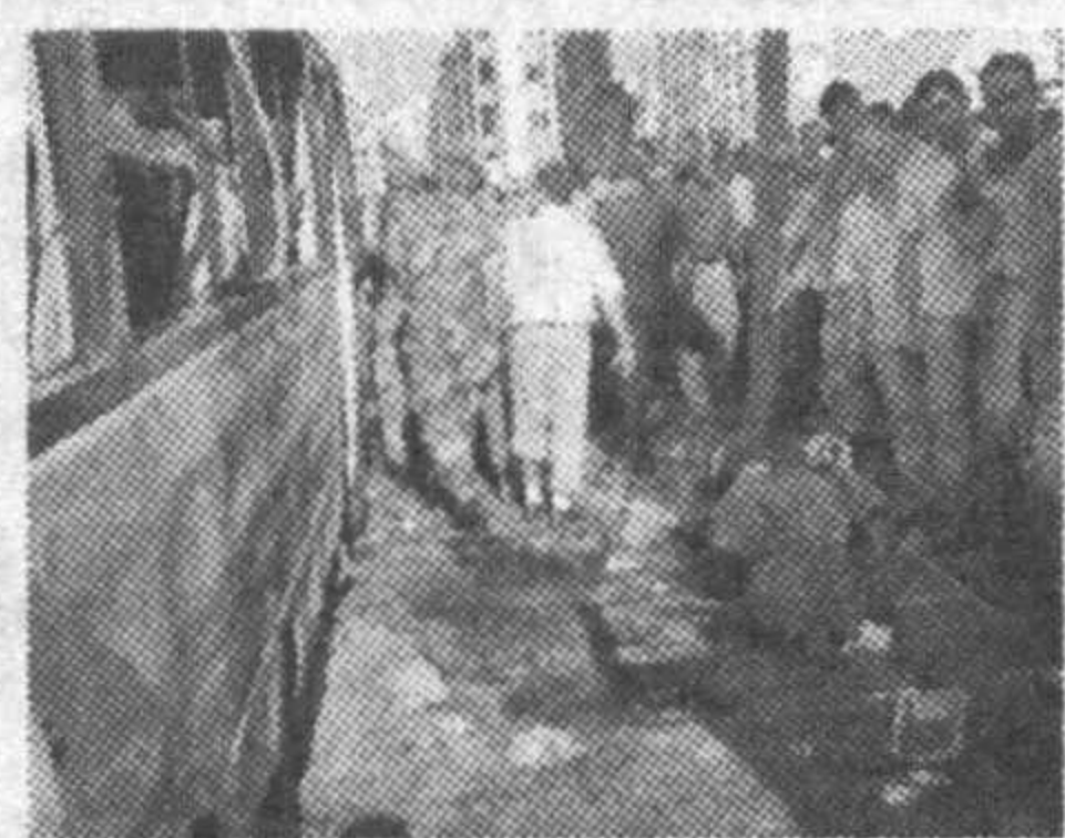
Хозирча мазкур қўпоровчилик бўйича жавобгарликни ҳеч бир террорчи ташкилот ўз зиммасига олмади.

Ливан шимолда террорчилар томонидан қўпоровчилик амалга оширилди. "Ассошиэтед-пресс" хабарида келтирилишича, террорчилар ҳарбийлар кетаётган автобус йўлига портловчи қурилма ўрнатган экан. Москва портали оқибатида камида 10 нафар ҳарбийнинг ҳалок бўлгани айтилмоқда. Яна 20 киши турли даражада тан жароҳати олган.