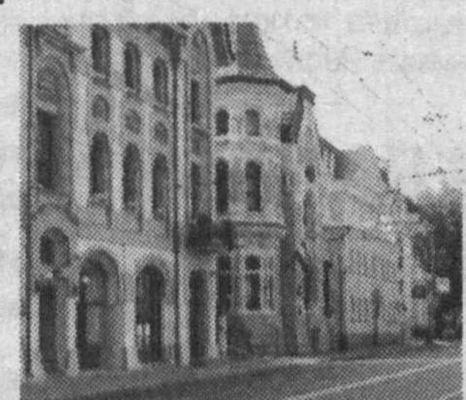
Кейинги ўринларни Гонконгдаги "Seven Road", Нью-Йоркдаги Бешинчи Авееню, Париждаги "Montaigne" Авеенюси, Москвадаги "Остоженка" кўчалари эгаллаган.

Яқинда Лондондаги "Wealth-Bulletin" тадқиқот маркази томонидан ўтказилган "Дунёдаги энг қиммат кўчалар рўйхати"дан шундай хулоса келиб чиқди. "Бизнес-стил" интернет шаҳрига кўра, қиммат кўчалар рўйхатида биринчи ўрин Монако шаҳридаги "Avenue Princesse Grace" кўчасига насиб этди. Бу кўчадан уй сотиб олиш учун 41 млн. АҚШ доллари сарфлаш керак. Ернинг ҳар бир квадрат метри 190 миң АҚШ доллари атрофида туради.