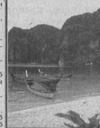
Н. ЖУРАЕВА, таржимон.

«Жаҳон адабиёти» олийк журнаlining ташкил этилиши, айниқса, таржимонларни қувонтириб юборди, чунки қозғоқ танқислиги сабабли нашриётларда таржима асарлар санарли даражада чоп этилаётганли. Журналнинг 1-сонини нашрдан чиқариш биланок, қўлма-қўл бўлиб кетди. Чунки ўқувчиларни журналнинг қай даражада чиқариш жуда қизиқтираётган эди. Унда таржима асарлар билан бир қаторда ўзбек адиб ва шоирларининг ҳам асарлари ёритилди. Бу айрим ўқувчиларни ҳайрон қолдирди. «Ие, бу журналда фақат таржима асарлар берилиши керак-ку», деганлар ҳам бўлди. Айрим ўқувчилар эса бу гапни сўзлаганларга: «Ўзбек адабиёти ҳам жаҳон адабиётининг бир бўлаги-ку», деб жавоб беришди. Энг қувонарли ҳол, нашриётлардан қадамларини тортиб кетган таржимонлар тахририятимиз қосида ҳозирча юзирилар. Улар журнал ўқувчиларига манзур бўладиган асарлар таржимаси устида иш олиб бораётганлар. Устоз таржимонлар тахририятга қайси асарларни таржима қилиш кераклиги ҳақида маслаҳатларини бераётганлар. Бу эса журналнинг мундақижаси ранг-баранг бўлишида катта аҳамиятга эга. «Жаҳон адабиёти»нинг қўлма-қўл бўлиб кетаётганидан шўни англаймизки, таржима асарларига ўзбек ўқувчиларининг иштиёқи балинд экан. Бу иштиёқ таржимонларга катта масъулият юклайди, албатта. Асар қай тилдан таржима қилинмасин, таржимонлар олдида турган катта вазифа — асарнинг бос-бутунлигича охирини тўқмай, рангин бўёқларини йўқотмай, асл нусхадан таржима қилиб, ўзбек ўқувчиларига етказиб беришда.