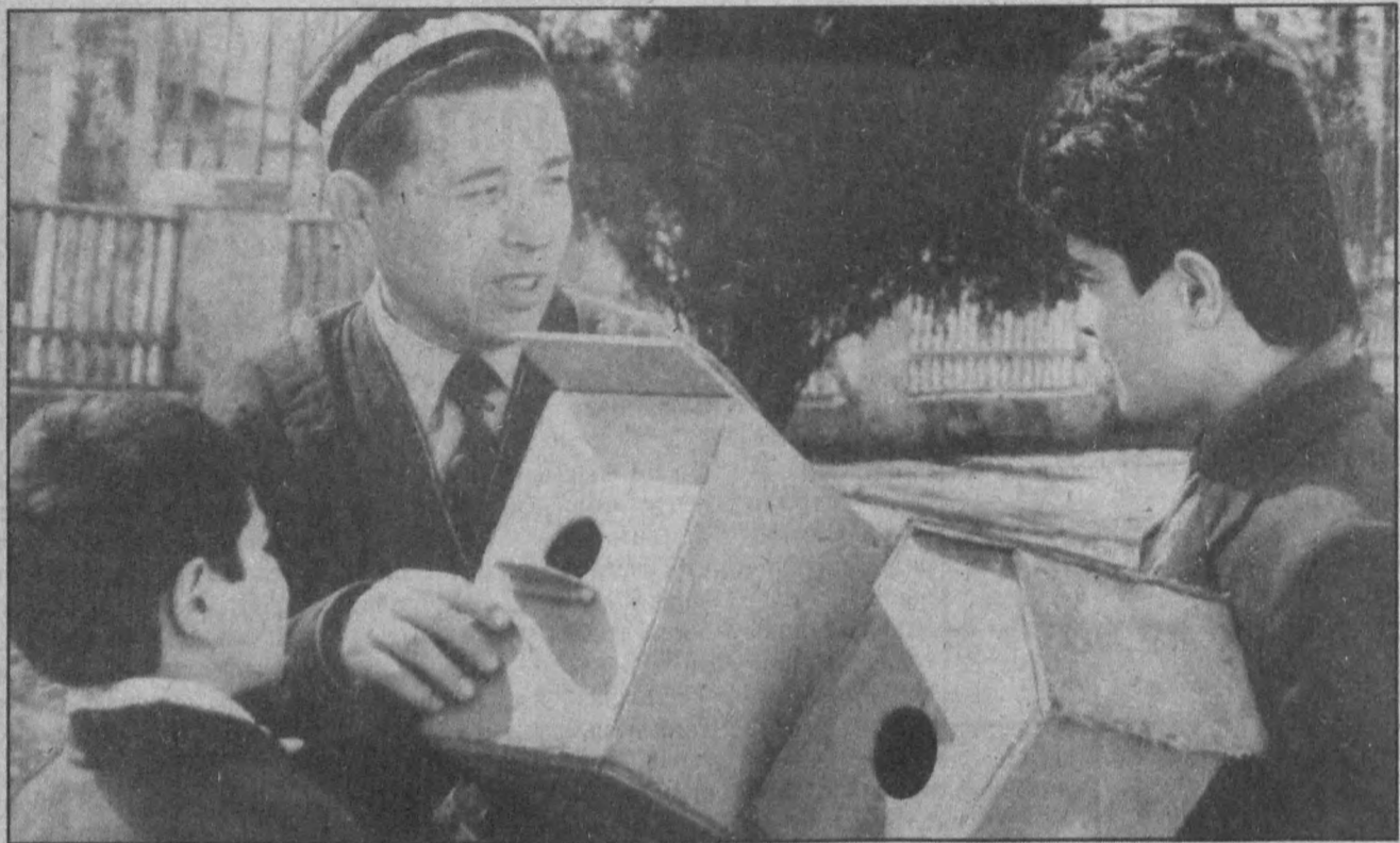
Баҳорий насим бизга янги ва янги сурури билан бирга, табиатнинг қаноатли эркатойлари музур-музур-ю новосиси ҳам тортиқ этди. Иссиқ элардан бизни йўқлаб келгуси қаноатли дўстларимизга бизнинг тортиқимиз нима бўлади? Сиз суратда кўриб турган бу ишонлар анд шу ҳақда галлашай-гай бўлса, ажаб эмас. Демак, биз ҳам гафлатда эмас эканмиз, демак биз ҳам уларни кўриб олишга тайёрмиз. Хуш, ҳамма жойда ҳам шундайми? Бу ҳақда маҳалла-ю мактабларда яна бир ўйлаб кўришга тўри келади.

Музаффар Зоҳидов, «Жаҳон» АА мухбири, ТОКИО.