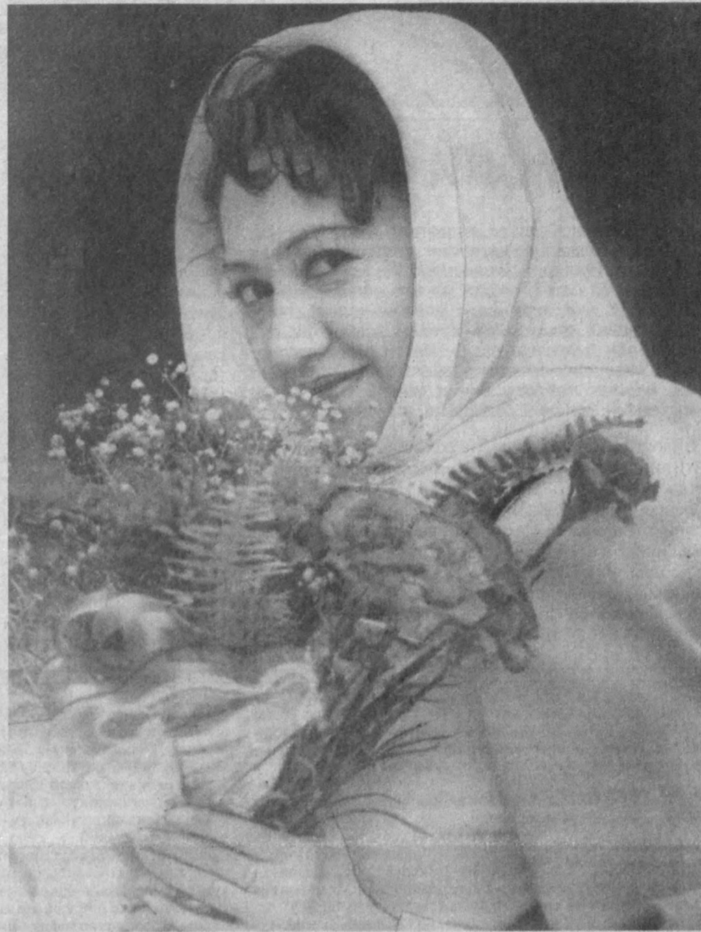
Шакис... Сиз — Гўзаллик! Баҳорлар ҳайрон... Сизни деб бирласа арзир қутблар.

турувчи ёруғлик. Бугун азиз ва озоД Ватанимизга содиқ, юртимиз шухратига шухрат қўшадиган оқил, шижоатли, бақувват, мамлакатимиз истиқлолини фидокорона ҳимоя этмоққа қодир авлодни тарбиялашни барча аёлларимиз, оналаримиз ўз умрларининг мазмуни деб биладилар. 1998 йилнинг Оила йили деб эълон қилиниши ҳам бежиз эмас, албатта. Оила миллатнинг, демак, Ватанининг буюк келажакини улғайтирувчи муқаддас бешик. Униб-ўсайтган авлоднинг соғлом, маънавий етук, ватанпарвар бўлиб камол топиши оилага, бевосита Сиз — аёлларга боғлиқ эканини биз яхши биламиз. Шунинг учун ҳам аёл зотини ҳамisha эъзоз қиламиз, оналарни мўтабар билиб бошимизга кўтарамиз. Муҳтарам онахонлар, азиз опа-сингиллар! Сизларни гўзал айёмингиз билан яна бир бор чин дилдан қутлайман. Оллоҳ бахтингизни, иқболингизни ҳамisha зиёда этсин! Янги жамиятимизни, янги порлоқ келажакимизни куриш, фарзандларнинг камолини ва роҳатини кўриш, қадамлари кутлуғ келинлар тушириш, ширин-шакар набира-ларнинг бешигини тебратиш саодати ҳар бирингизга насиб этсин! Юртимиздаги тинчлик ва хотиржамлик кунингизни ҳамisha мунавар қилверсин! Рўзгорингиздан файзу барака ҳеч қачон аримасин, ризқингиз улуг, умрингиз узун бўлсин! Бахтимизга доимо соғ-омон бўлинг! Ислом КАРИМОВ