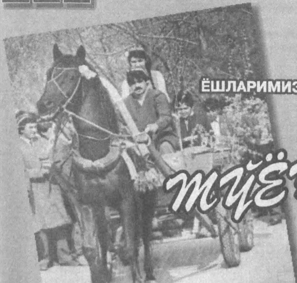
ЁШЛАРИМИЗ БАХТЛИ БЎЛИШСИН!

МЕҲРИ ДАРЁ ОНАХОНЛАР ВА НУРОНИЙ ОТАХОНЛАР УЧУН МАХСУС ОМОНАТЛАР