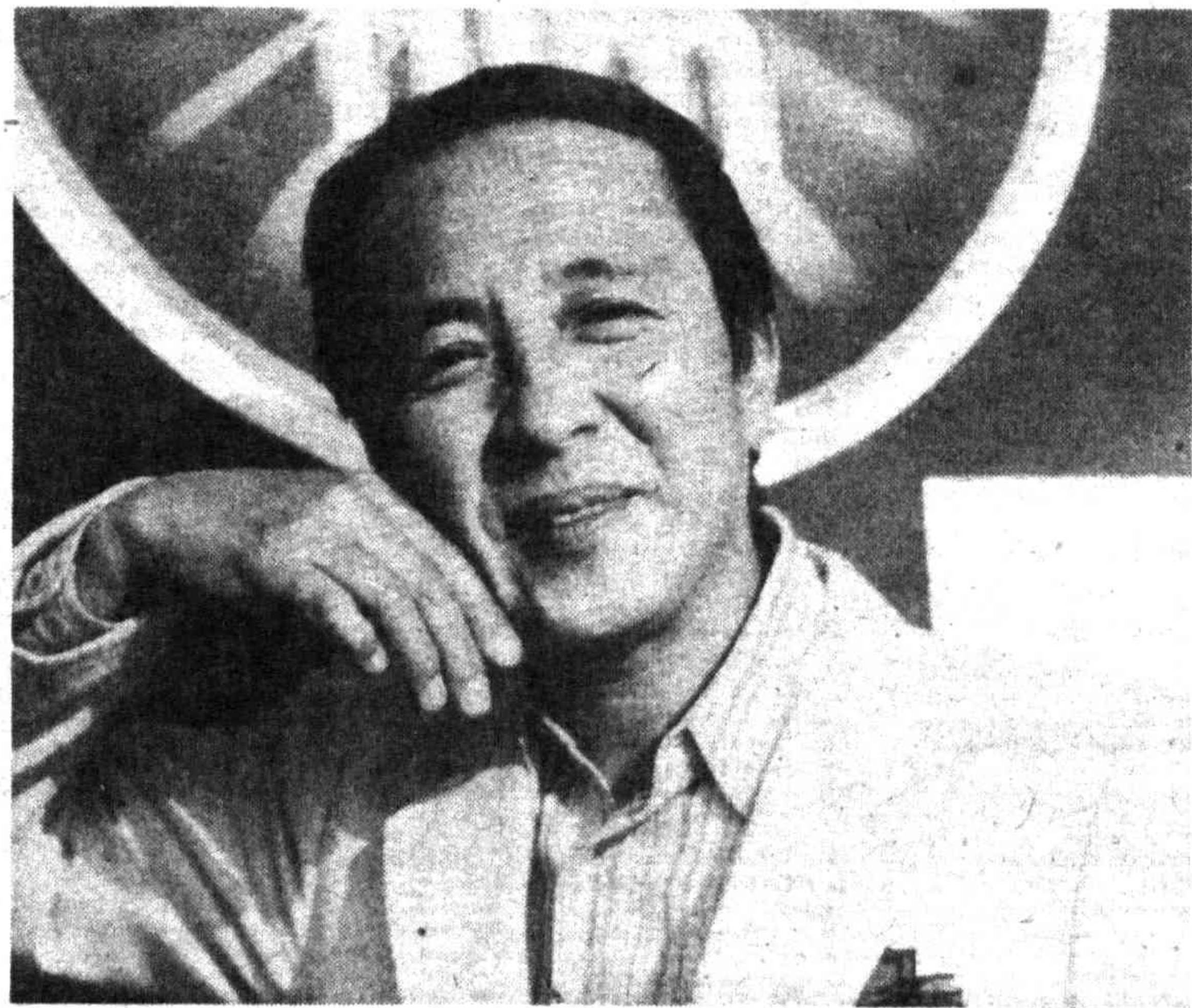
Ташкентцы встречались с актером Такахиро Тамура на кинофестивалях трех континентов. Вот и на этот раз мы увидим его в картинах, которые демонстрируются в дни праздника.