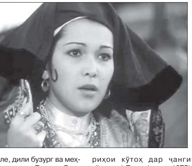
Бале, дили бузург ва меҳрпарваре дошт Тамира. Вале чашмонаш ҳаёлангез. Ҳузне дар онҳо ниҳон...