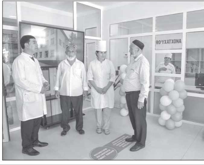
Маркази муштарак бе-морихоии шикастӣ аъзо ва дилу рағи байниноҳиявии