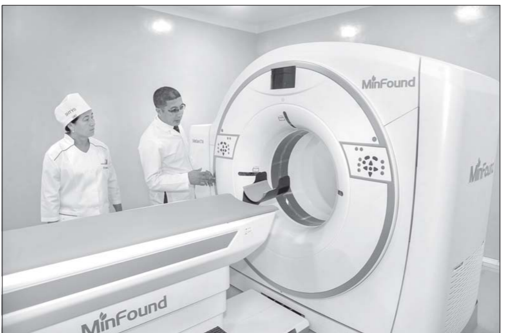
Дар ноҳияи Ёзёвони вилояти Фарғона Маркази муштарак бе-морихоии шикастӣ аъзо ва дилу рағи байниноҳиявии