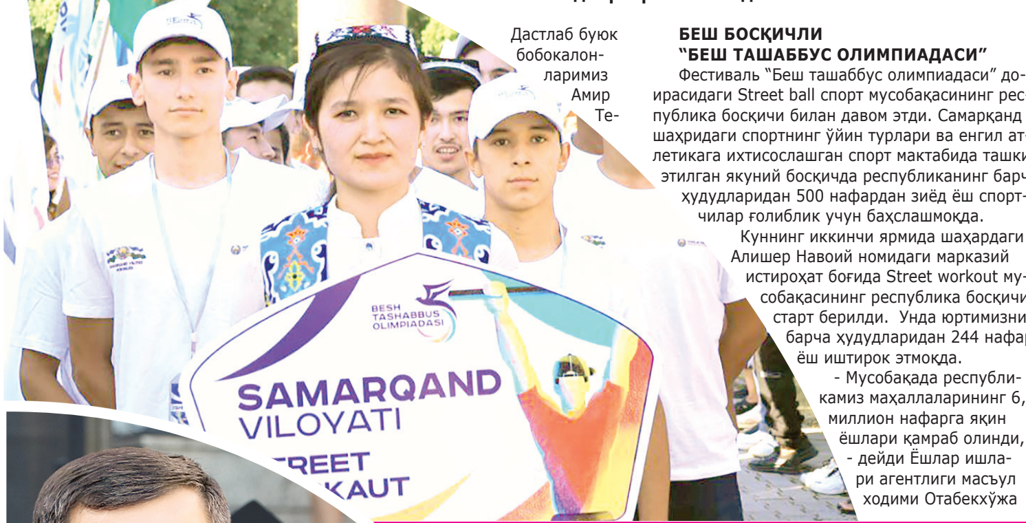
Дастлаб буюк бобокалонларимиз Амир Те-