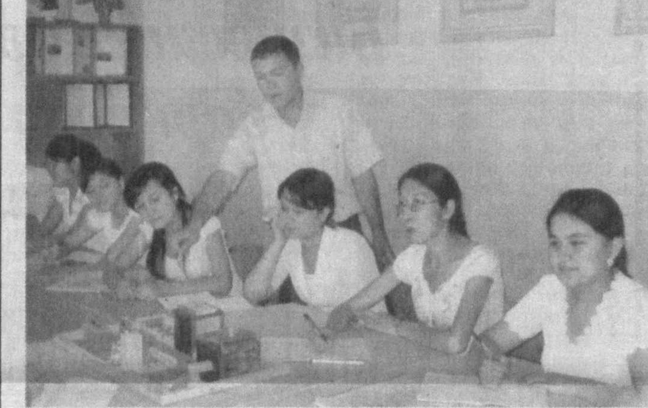
СУРАТЛАРДА: коллеж ҳаётидан лавҳалар.