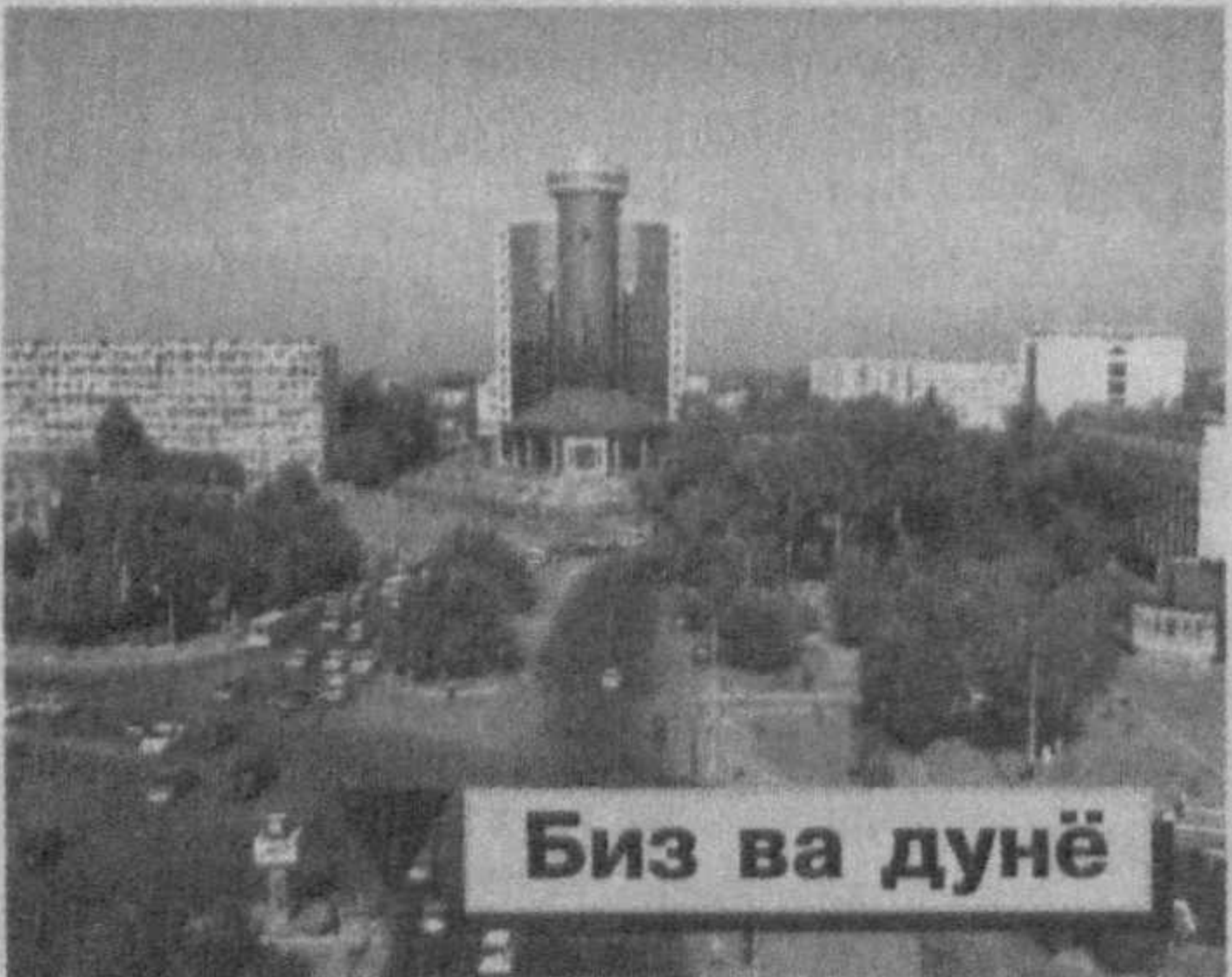
Биз ва дунё

доражада эътибор қаратилаётганидан далолат бериши таъкидланди. Тошкент — бутун дунёга машҳур олим ва уламолар шаҳри. Кафол Шойи, Шайх Хованд Тоҳур, Хожа Аҳрор Валий, Баҳриддин Чочий, Ҳофиз Кўҳақий, Абубакар Шойи каби кўлаб алломулар пойтахтимиз тарихида муносиб из қолдирган.