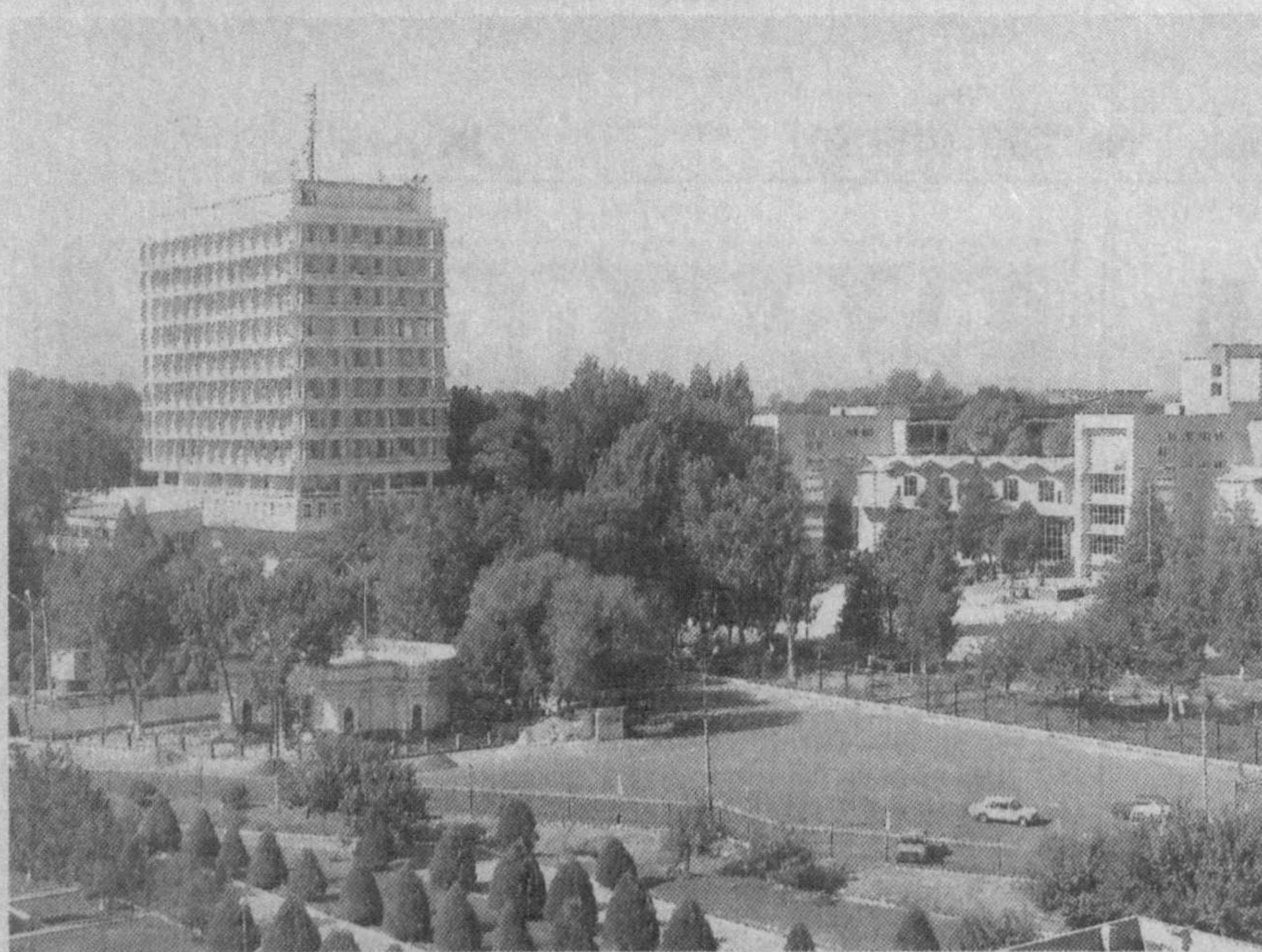
(Давоми. Боши 1-бетда).

Шу кунларда халқимиз томонидан табаррук 90 йиллик тавалуд тўйи нишонланаётган Мирзо Улугбек номидаги Ўзбекистон Миллий университети бу эгу ишни амалга оширишда ўзининг муносиб ҳиссасини қўшаётган олий таълим марказларидан биридир. Ўзбекистон Миллий университети (ЎЗМУ) — мамлакатимизда ва бутун Ўрта Осиё милоқасида энг нуфузли ва етакчи олий ўқув юртиларидан саналади. Университетимизнинг ёшларининг интелектуал ва маънавий салоҳиятини ошириш, юртимиз илм-фани ва маданияти, замонавий таълим тизимини ривожлантириш, юксак малакали мутахассислар тайёрлаш, йилит-қизларимизни ватанпарварлик ва умуминсоний қадриятларга ҳурмат руҳида тарбиялаш борасидаги хизматлари беқубеъдир. Шу боисдан