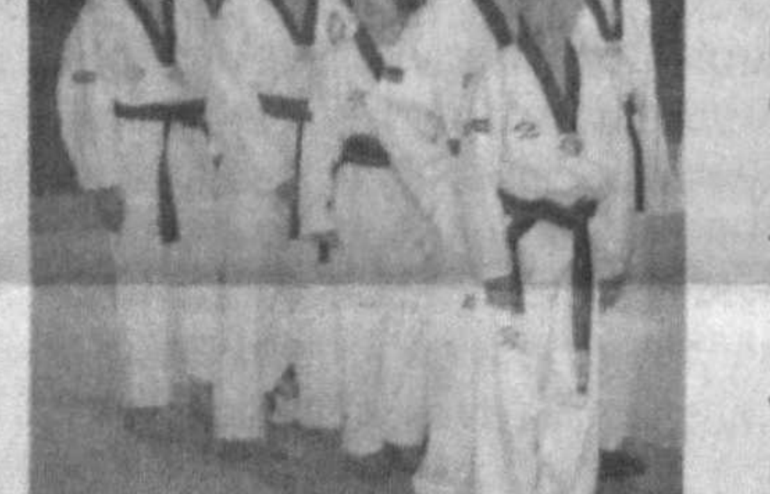
Марғилон шаҳрининг 2000 йиллиги муносабати билан ўтказилган турнирда шохсупанинг иккинчи погонасига қўтарилган бўлса, шу йил Асака шаҳрида Фарғона водийси таэквондочиларининг очик чемпионатида ғолибликни кўлга киритди.