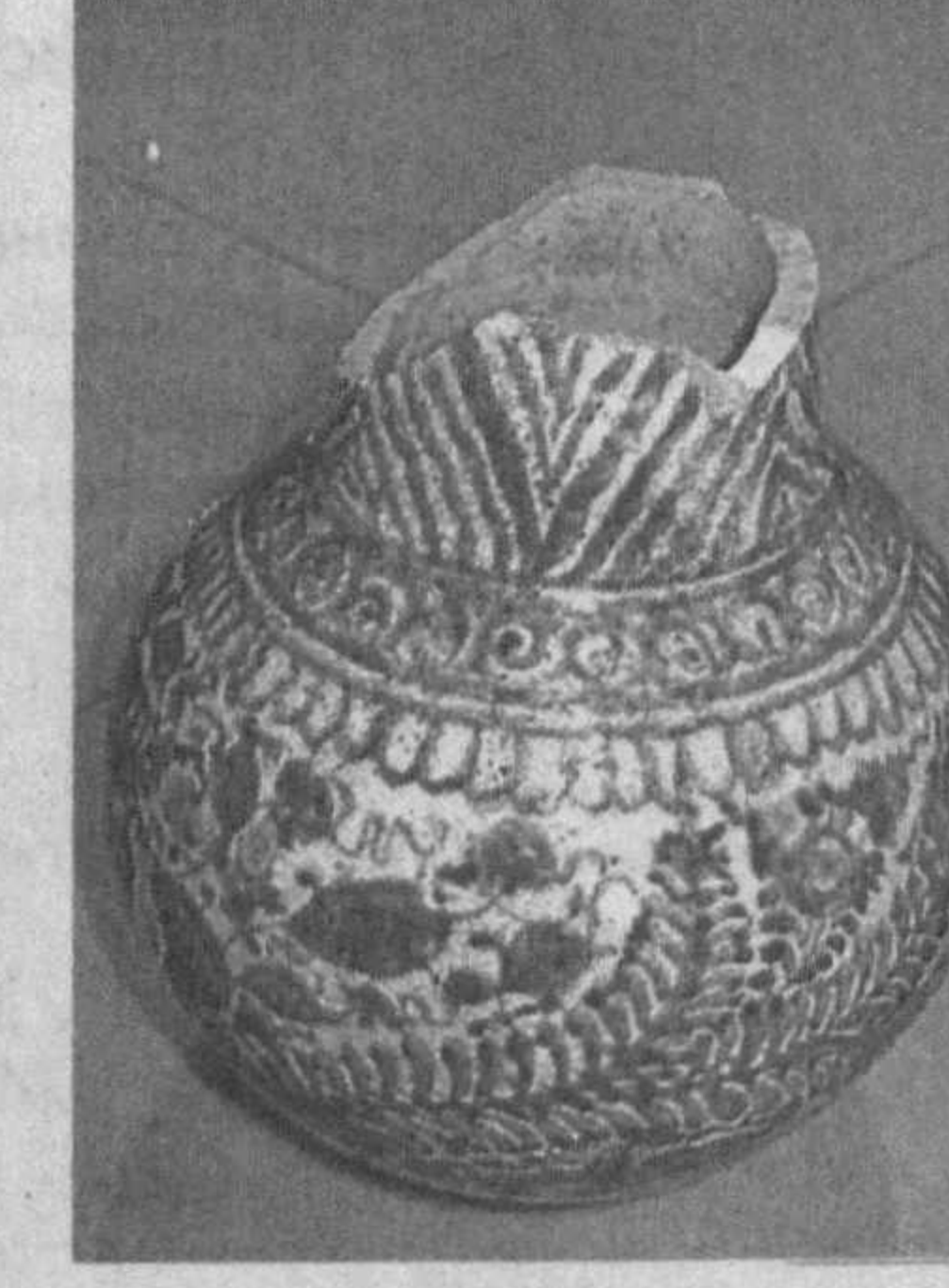
Азиз ШАРИПОВ, Аббос МИРЗАХИМОВ, УЭР ФА Темурийлар тарихи давлат музейи илмий ходимлари.

Музей жамоаси келгусида музейни Амир Темур ва темурийлар даври тарихини ўрганувчи ва тарғиб қилувчи илмий, маънавий-маърифий марказга айлантириш, унинг экспозициясини темурийлар даврига оид ёдгорликлар билан янада бойитиш, чет эл музейлари билан алоқаларни янги погоналарга кўтариш, ўзаро кўргазмалар ташкил этишни ўз олдига мақсад қилиб қўйган.