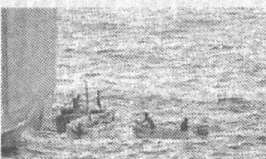
Сомалилик қароқчилар Аден кўрғазида Дания мамлакатига тегишли танкер (юк ташийдиган кема)га ҳужум уюштиришди.

«Associated Press» агентлиги хабарига маълум қилинишича, қароқчилар билан денгизчилар ўртасидаги тўқнашув бир неча соат давом этган. Дания қуролли кучларига тегишли вертолёт этиб келгангина, босқинчилар чекинишга мажбур бўлган.