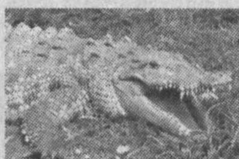
АҚШнинг Флорида штатида 16 ёшли ўспирин йигит тимсоҳни ўлдиргани учун жиноий жавобгарликка тортилиши мумкин.

Мазкур штатнинг табиати муҳофаза қилиш қўмитаси баёнида келтирилишича, тимсоҳнинг бошиси ва думиси танаси Флорида университетини ҳудудидан топилиган. Қўлга олинган ўспирин жониворнинг кесиб олинган аъзоларини қаерга гумдон қилганини айтмаган.