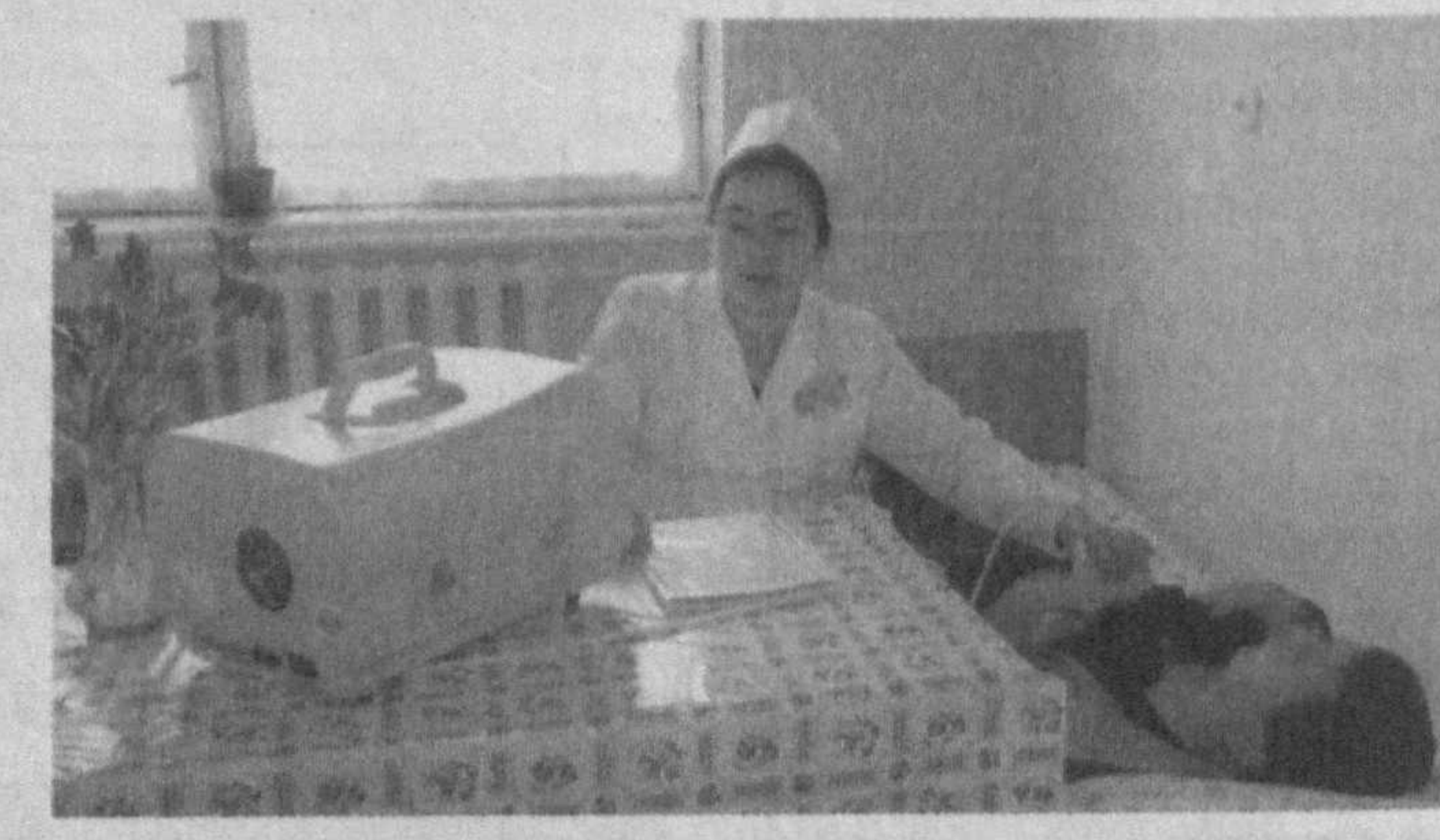
“Чимён” санаторийсининг минерал сувини олиб кўрайлик. Олтингургуртли бу сув шифобахшлиги борасида Сочининг машҳур “Мацеста” сувларидан асло қолишмайди. “Чортқо” ва “Хонқа” санаторийларининг минерал суви йод ва бромга бойлиги билан даволаш усули кенг қўлланилади. Сульфидли бу балчиқ Жиззах вилоятининг баликчи қўлидан келтирилган бўлиб, махсус ўраларда сақланади. Шу би...

Бундан ташқари, мижозларга қулайлик яратиш мақсадида 3-4 ўринли хоналардан воз кечилмоқда, хозирда хоналарнинг асосий