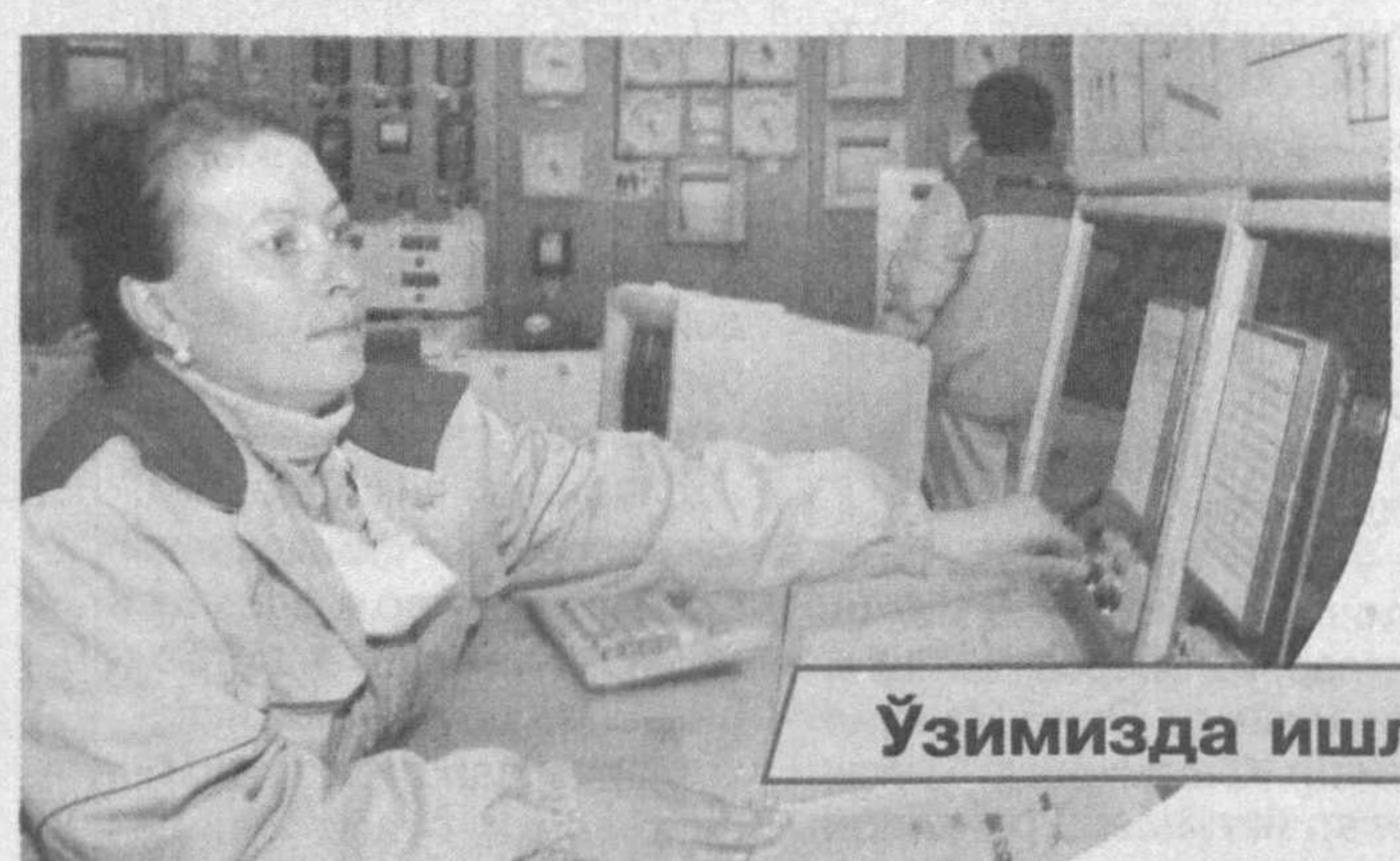
Ўзимизда ишлаб чиқарилган

Мамлакатимизда Президентимиз раҳнамолиги ва ғамхўрлиги билан иқтисодиётнинг барча тармоқлари техник ва технологик жиҳатдан қайта жиҳозланиб, ишлаб чиқаришга замонавий ускуналар кенг жалб этилмоқда. Бу жаҳон стандартлари талаблари даражасида юқори сифатли маҳсулотлар ишлаб чиқариш имконини берапти. Буни пойтахтимиздаги ювиш воситалари ишлаб чиқариладиган «Pakson Toshkent» кўшма корхонаси мисолида ҳам кўришимиз мумкин.