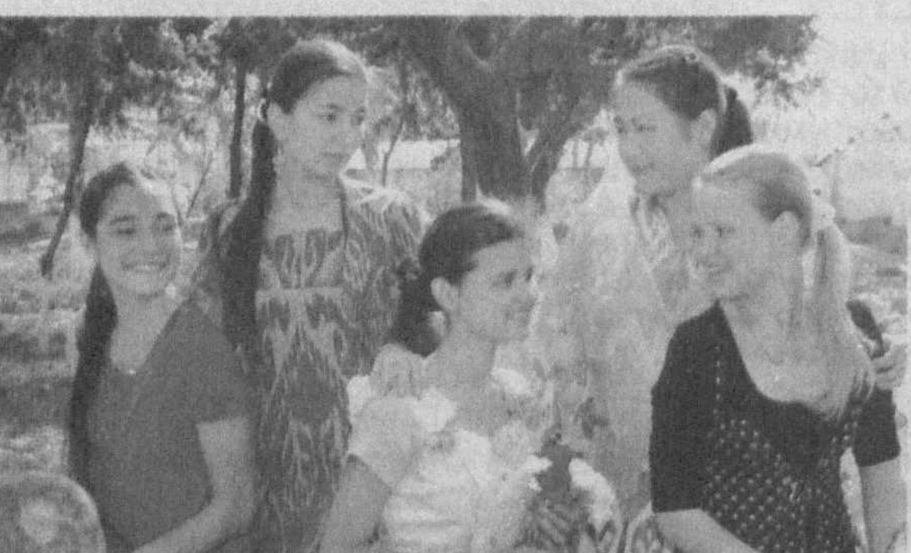
16 ноябрь — Халққо багрикенглик куни

лат ва аъналар соҳасидаги ўзига хос талаб ва эҳтиёжларини қондириш, шу тарика, уларни Ўзбекистонда янада мустаҳкамроқ жипслаштиришга хизмат одатлар ва аъналар соҳасидаги ўзига хос талаб ва эҳтиёжларини қондириш, шу тарика, уларни Ўзбекистонда янада мустаҳкамроқ жипслаштиришга хизмат