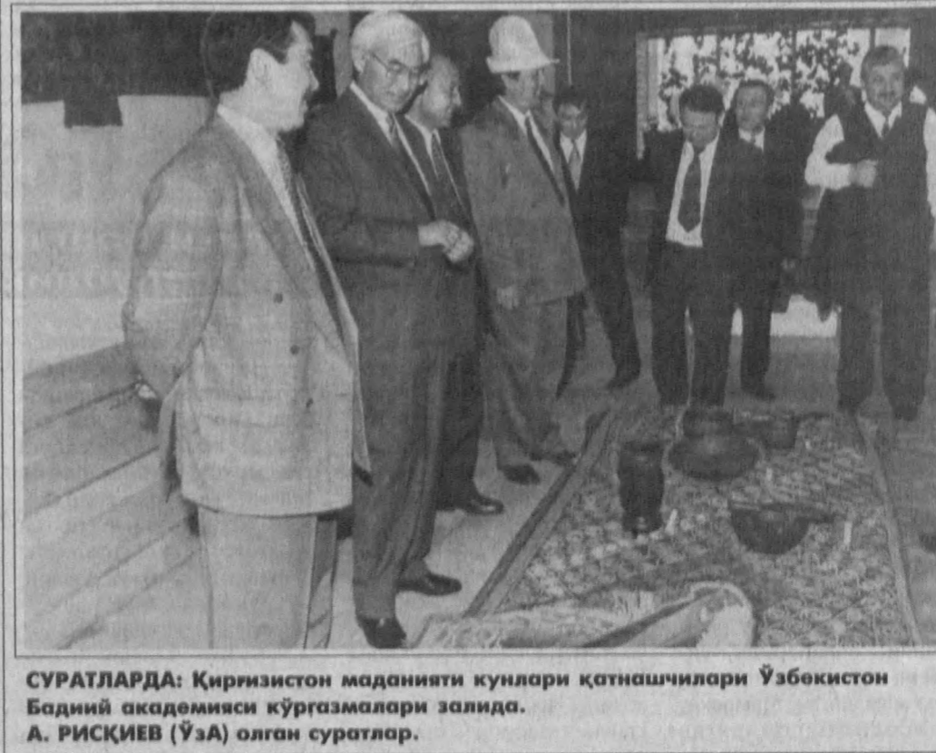
СУРАТЛАРДА: Қирғизистон маданияти кунлари қатнашчилари Ўзбекистон Бадий академияси кўргазмалари замида.