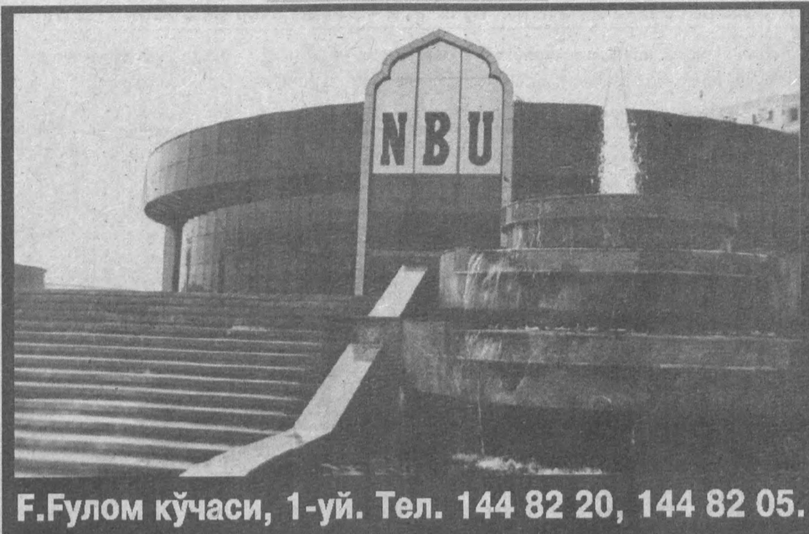
F.Фулом кўчаси, 1-уй. Тел. 144 82 20, 144 82 05.

БИЗ МИЖОЗЛАРИМИЗНИНГ ТОПШИРИҚЛАРИ ИШОНЧЛИ, СИФАТЛИ ВА ТЕЗ БАЖАРИЛИШИГА КАФОЛАТ БЕРАМИЗ