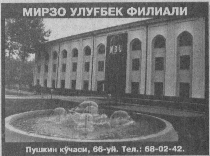
МИРЗО УЛУГБЕК ФИЛИАЛИ