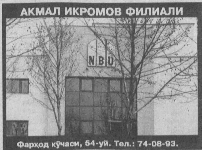
АКМАЛ ИКРОМОВ ФИЛИАЛИ