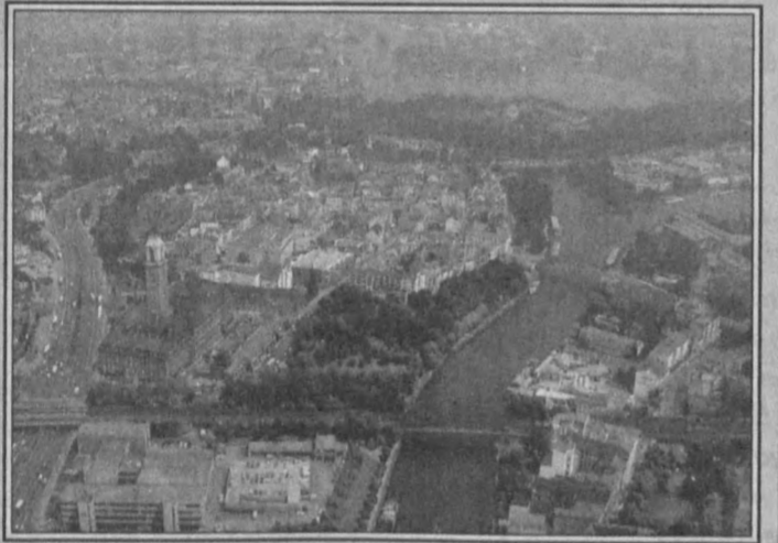
Европа деганда кўз ўнгини...