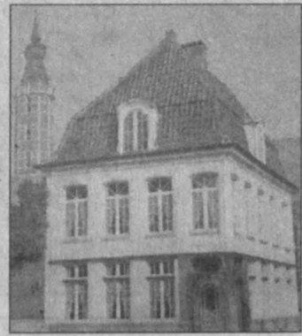
корларимизни ўзига чорламоқда. Ўзбекистон ва Белгия ўртасидаги алоқаларни ҳам ана шу ўзаро интилишларнинг самараси сифатида баҳоламоқ жоиз.

Бугунги кунда 15 давлатни бирлаштириб турган «Умумевропа уйи»да 400 миллиондан ортиқ аҳоли истиқомат қилади. Мамлакатимиз ҳукумати кейинги йилларда ушбу давлатлар билан ҳар томонлама манфаатли ҳамкорлик алоқаларини ривожлантириш йўлидан дадил бормоқда. 1996 йилнинг июнида Европа Иттифоқи билан мамлакатимиз ўртасида Шериклик ва ҳамкорлик тўғрисида имзоланган тарихий битим фикримиз далилидир. Айни пайтда республикамизнинг Европа Иттифоқи билан муносабати фақат мазкур битим билан чекланиб қолганича йўқ. Бугунги кунда Ўзбекистон билан Европа давлатлари ўртасидаги икки томонлама муносабатлар ҳам ўзининг илк натижаларини бермоқда. Қолаверса, мамлакатимизда амалга оширилган ислохотларни янада ривожлантиришда европаликларнинг бозор